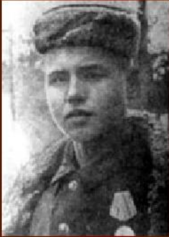
Лёня Голиков - партизанский отряд