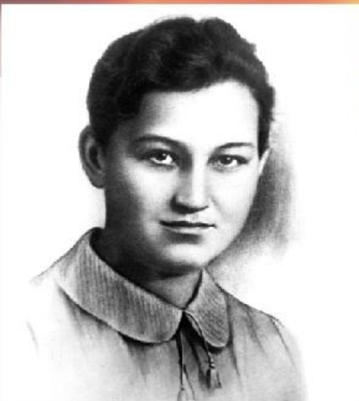
Зоя Космодемьянская 13. 09.1923 г.- 29. 11. 1941 г.