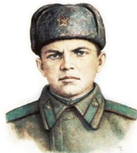
Александр Матросов 05.02.1924 г. – 27.02. 1943 г.