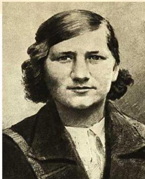
Елизавета Чайкина 28.08.1918 г.– 23.11.1941 г.