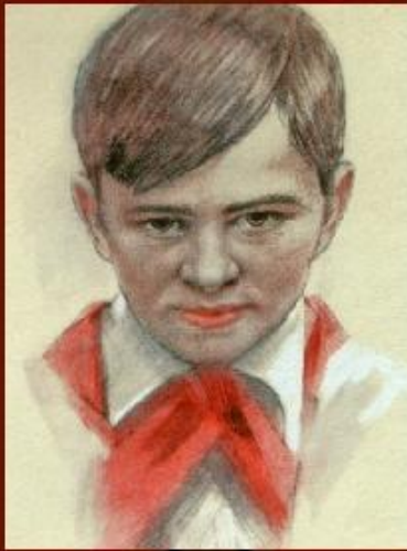
Валя Котик - Шепетовская подпольная организация