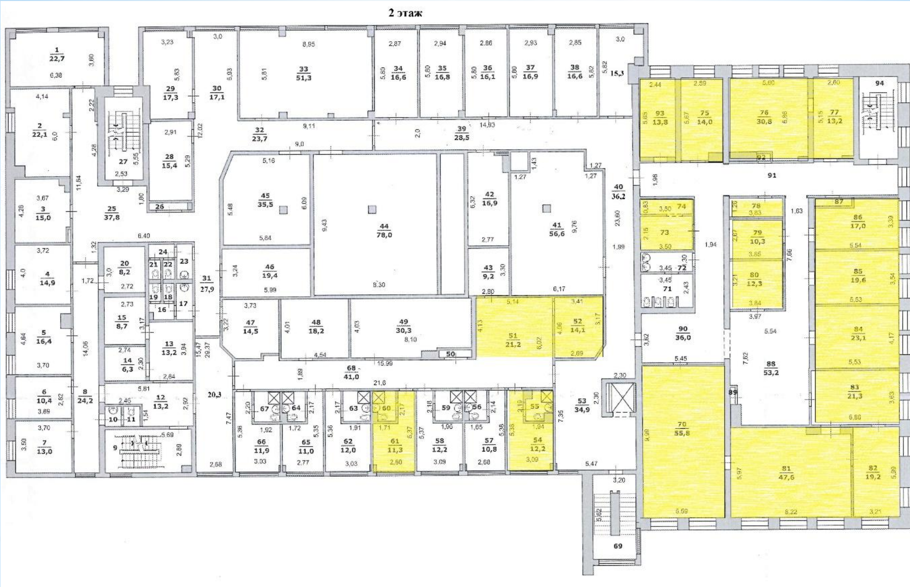
Схема 2 этажа административного здания аэропорта