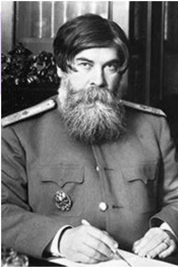
Владимир Михайлович Бехтерев