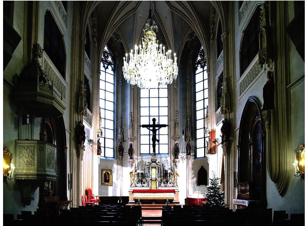
Венская придворная капелла.