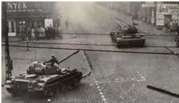
Советские танки Т-54 в Будапеште