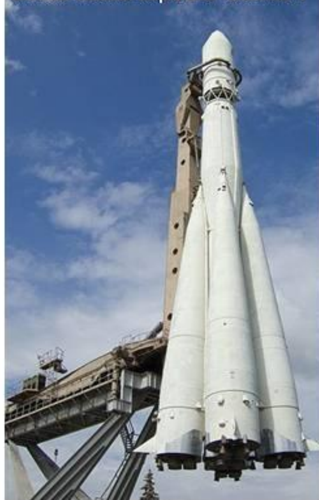
Космический корабль "Восток-1"

1955 г. – начало строительства космодрома Байконур (Казахстан).