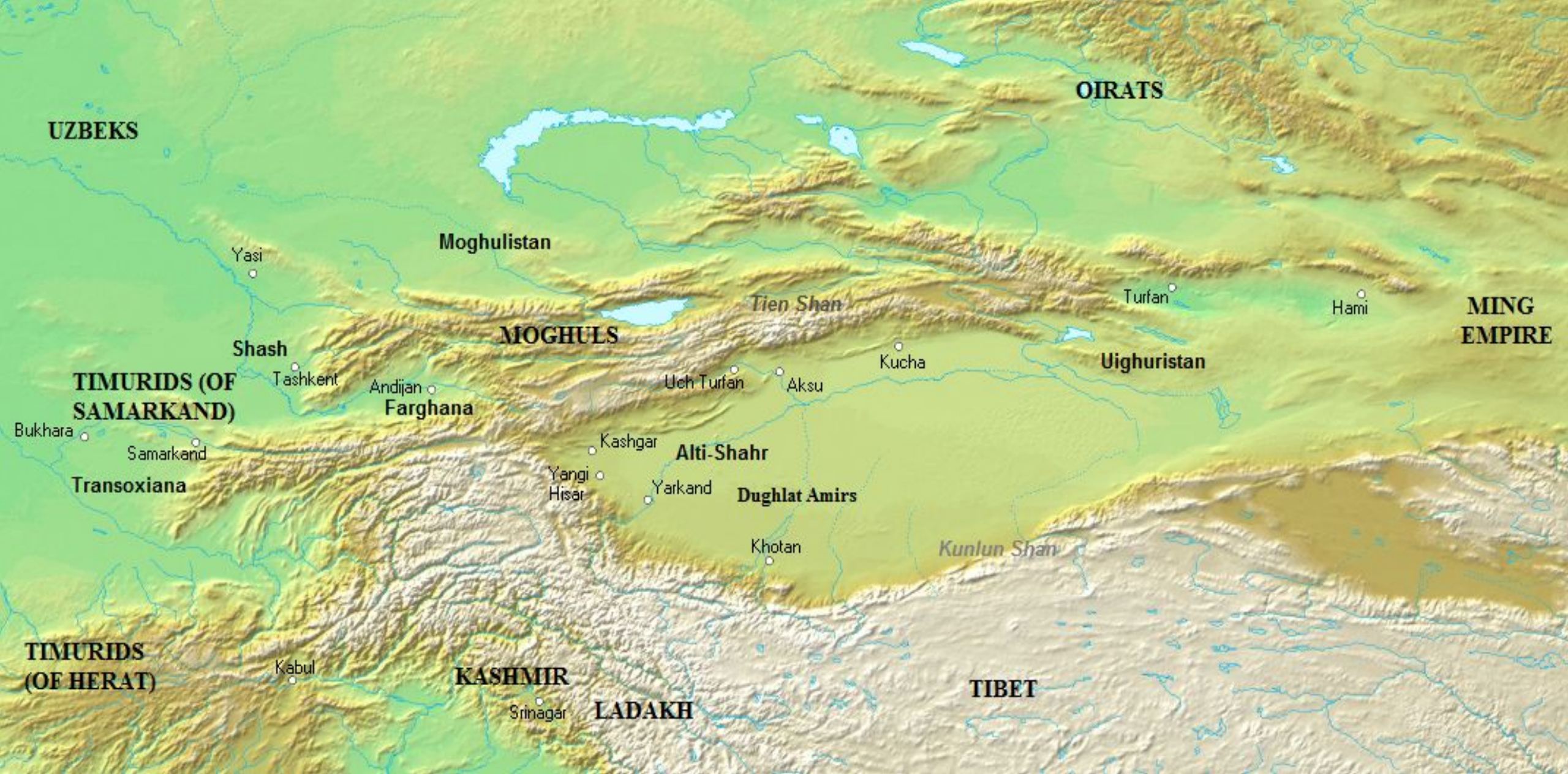
Моголистан в 1450 г.