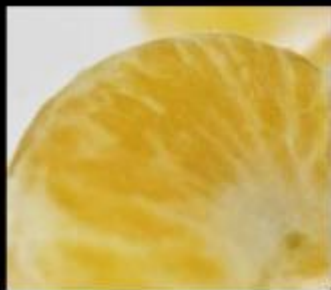
Mandarin Italy Orpur ®