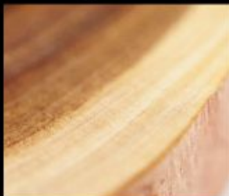
Cedarwood Fraction Texas