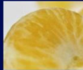
Mandarin Italy Orpur®

□ Пряный, чувственный аромат. Кардамон в паре с нотами шафрана добавляет парфюму еще большую сексуальность. Яркие древесные ноты Adrenaline дополнены захватывающим аккордом кедрового и черного дерева, что придает Adrenaline Night притягательный шлейф.