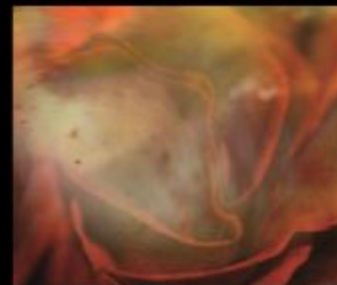
Pomarose Givaudan ®