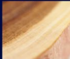
Cedarwood Fraction Texas