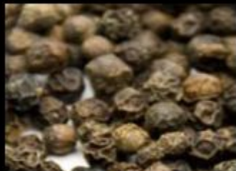
Black Pepper Madagascar Orpur ®