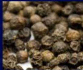
Black Pepper Madagascar Orpur®