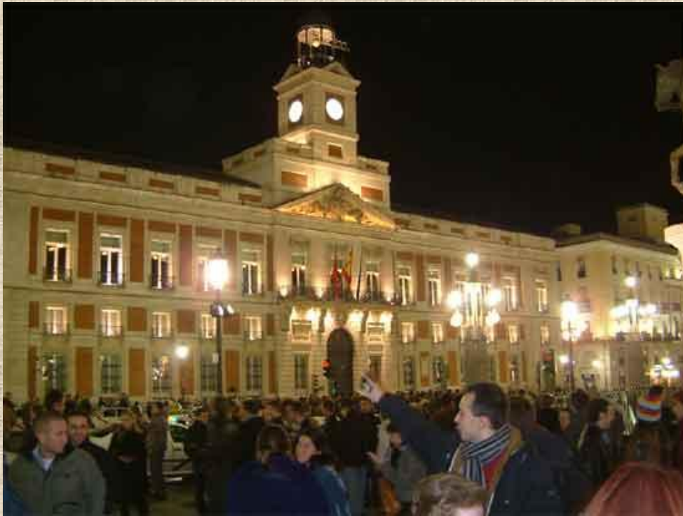
La Puerta del Sol en Madrid