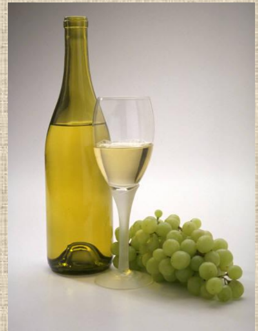
Las uvas de la suerte