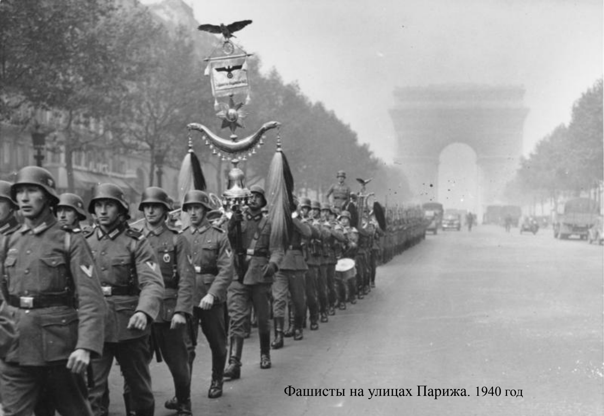
Фашисты на улицах Парижа. 1940 год

После поражения Франции, он переехал к сестре в не оккупированную часть страны, а позже выехал в США.