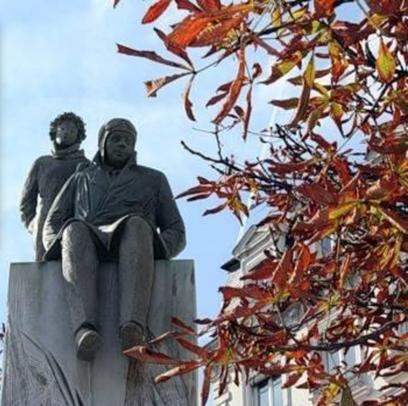
Памятник Маленькому принцу и Большому человеку в Лионе.