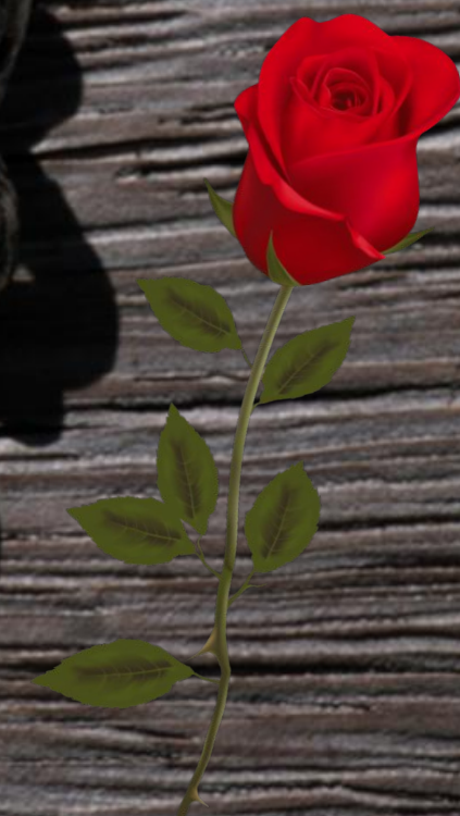
Спустя полвека, на марсельском побережье местный рыбак Жан-Клод Бьянко нашел браслет. На нем были выгравированы имена лётчика и его любимой Розы.