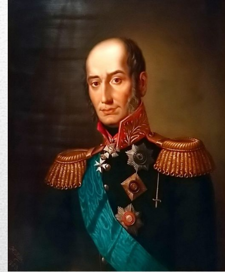
Барклай де Толли Михаил Богданович ( 1761-1818 )