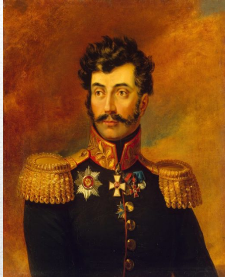
Багратион Петр Иванович ( 1765-1812 )