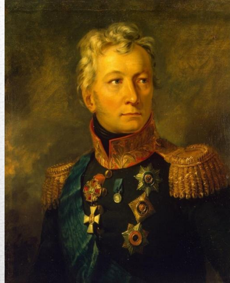
Александр Петрович Тормасов ( 1752-1819 )