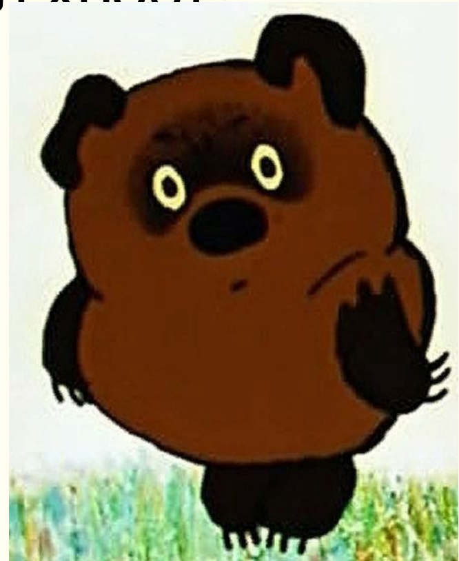
2. Винни Пух