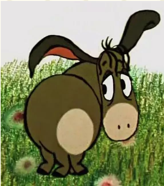
1. Ослик Иа

Вопрос 1: У кого из них по сюжету сказки пропал хвост?