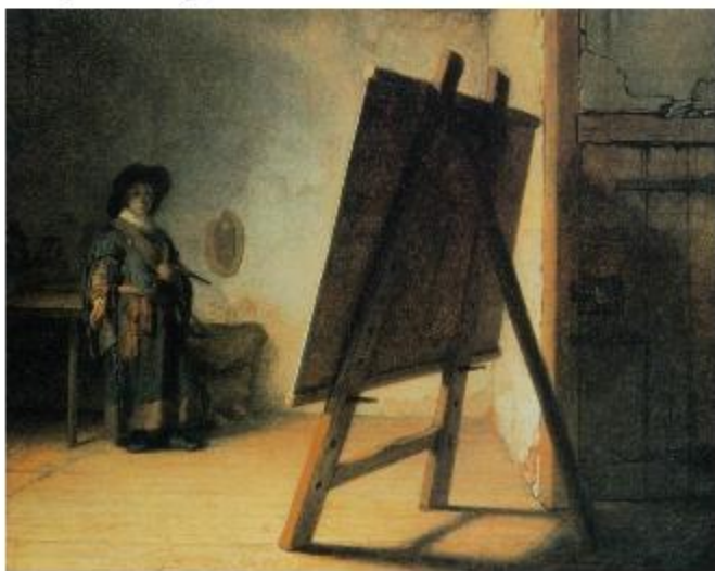
«Художник в своей мастерской» (1628)