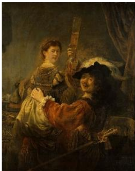
«Блудный сын в таверне» (1635)