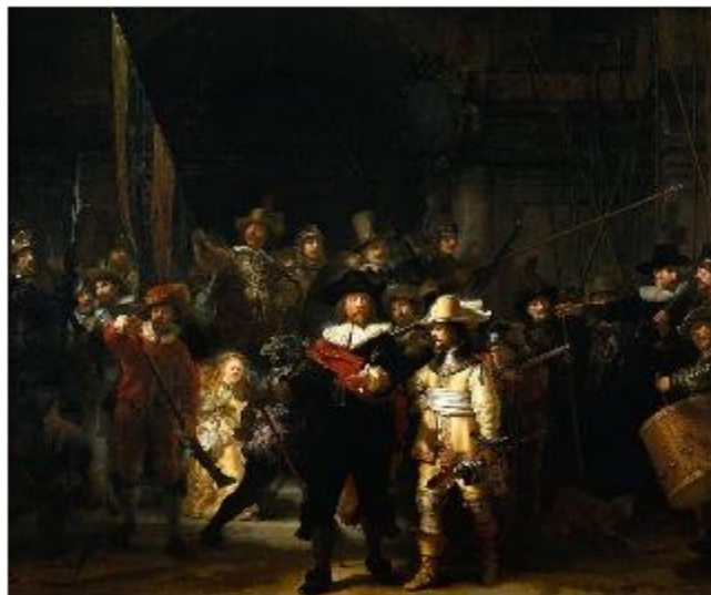
«Ночной дозор» (1642)