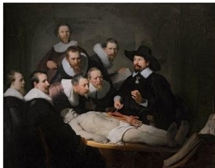
«Урок анатомии доктора Тульпа» (1632)