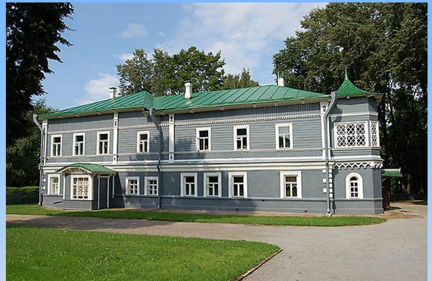
Ныне Дом-музей им. Чайковского