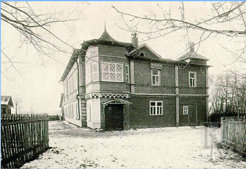
Дом П. И. Чайковского в Клину. 1893 год.

В 1892 году обосновался в Клину, под Москвой