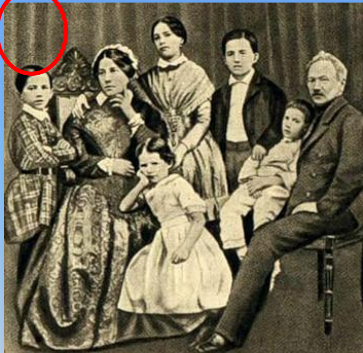
Семья Чайковских в 1848 году (крайний слева — Пётр Ильич)

Родился 25 апреля 1840 года в селении при Камско - Воткинском заводе Вятской губернии (ныне город Воткинск, Удмуртия). Пётр был вторым ребёнком в семье.