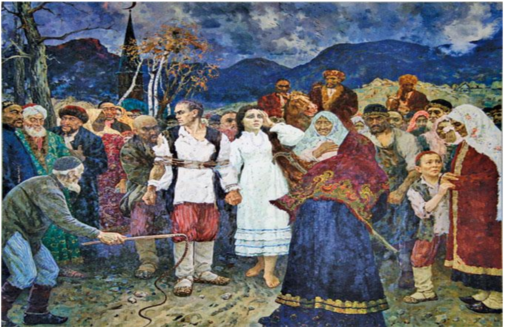
«Шәриғәт корбандары» Р. Б. Нурмөхәмәтов М. Гафуринының «Карайөзлөләр» әсәренә арнап язылған һурәт