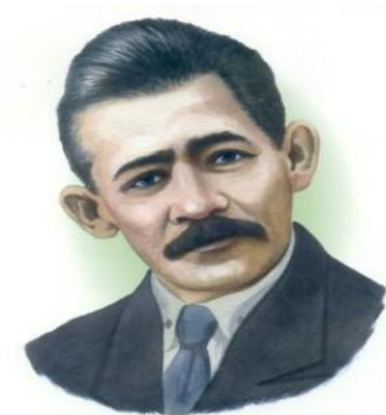
Мажит ҒАФУРИ (1880–1934) Мажит ҒАФУРИ Башҡортостандың иккенсе шағиры. Ғафури Мажит Ғафури