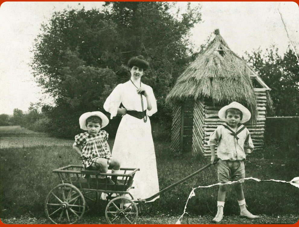
Антуан де Сент-Экзюпери с матерью и сестрой