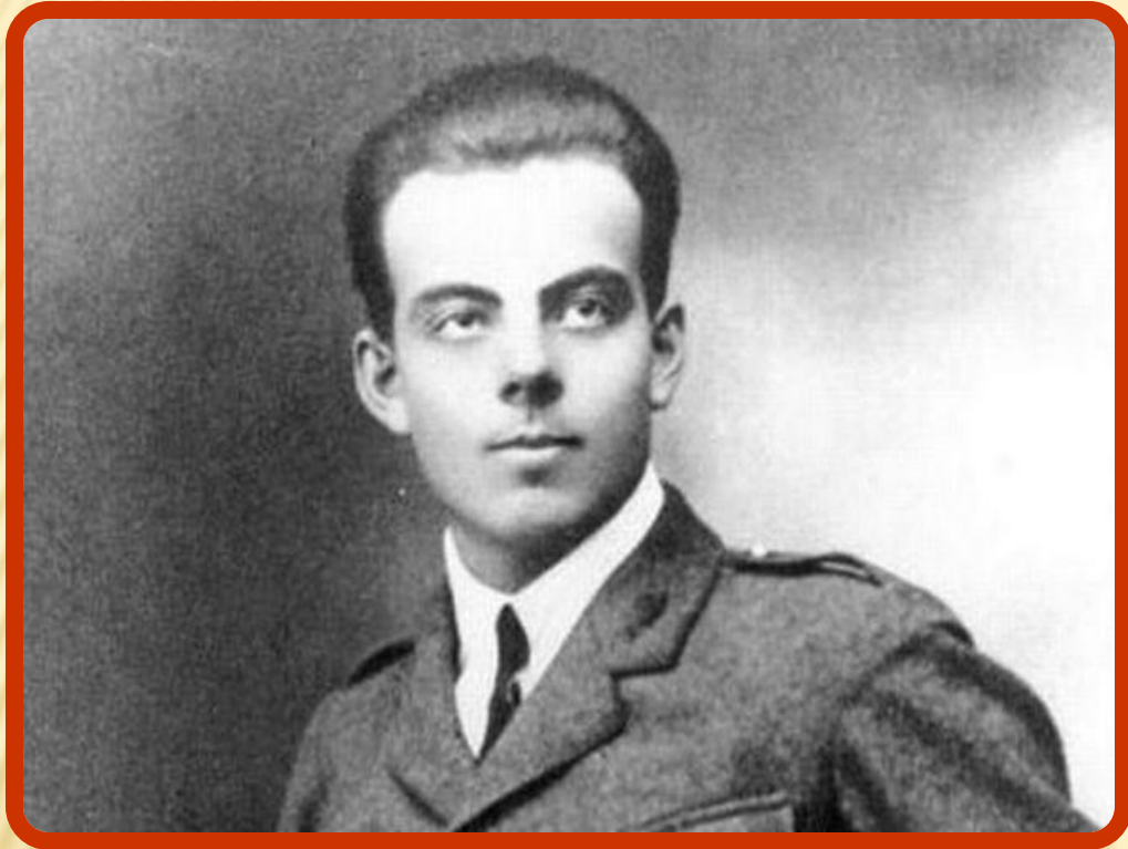
Антуан де Сент-Экзюпери в молодости

Антуан де Сент-Экзюпери учился в христианской школе в Лионе, а затем в иезуитской в Монтрё. В 14 лет стараниями матери был отправлен в швейцарский католический пансион. В 1917 году Антуан поступил на факультет архитектуры в парижскую Школу изящных искусств. Бакалавр с дипломом на руках готовился к поступлению в военно-морской лицей, но провалился на конкурсном отборе.