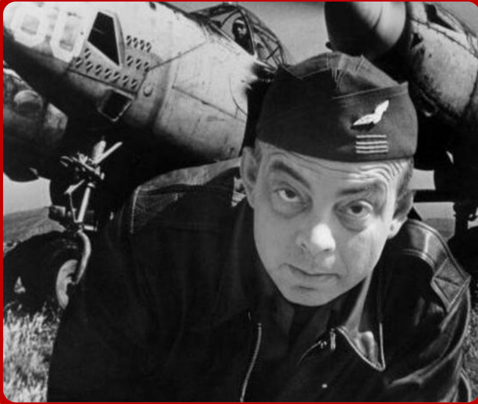
Летчик Антуан де Сент-Экзюпери

В 1921 году Сент-Экзюпери был призван в армию, где записался на курсы пилотов и вскоре сдал экзамен на гражданского летчика. Позже повысил квалификацию до военного летчика. В 1923 году с ним произошла авиакатастрофа. Экзюпери получил черепно-мозговую травму, оставил авиацию и переехал жить в Париж, занялся писательством. В 1925 году Экзюпери становится авиапилотом «Аэропосталь», занимается доставкой почты в Африку. Став начальником аэропорта в Кап-Джуби (на границе Сахары), Антуан находит время и на творчество.