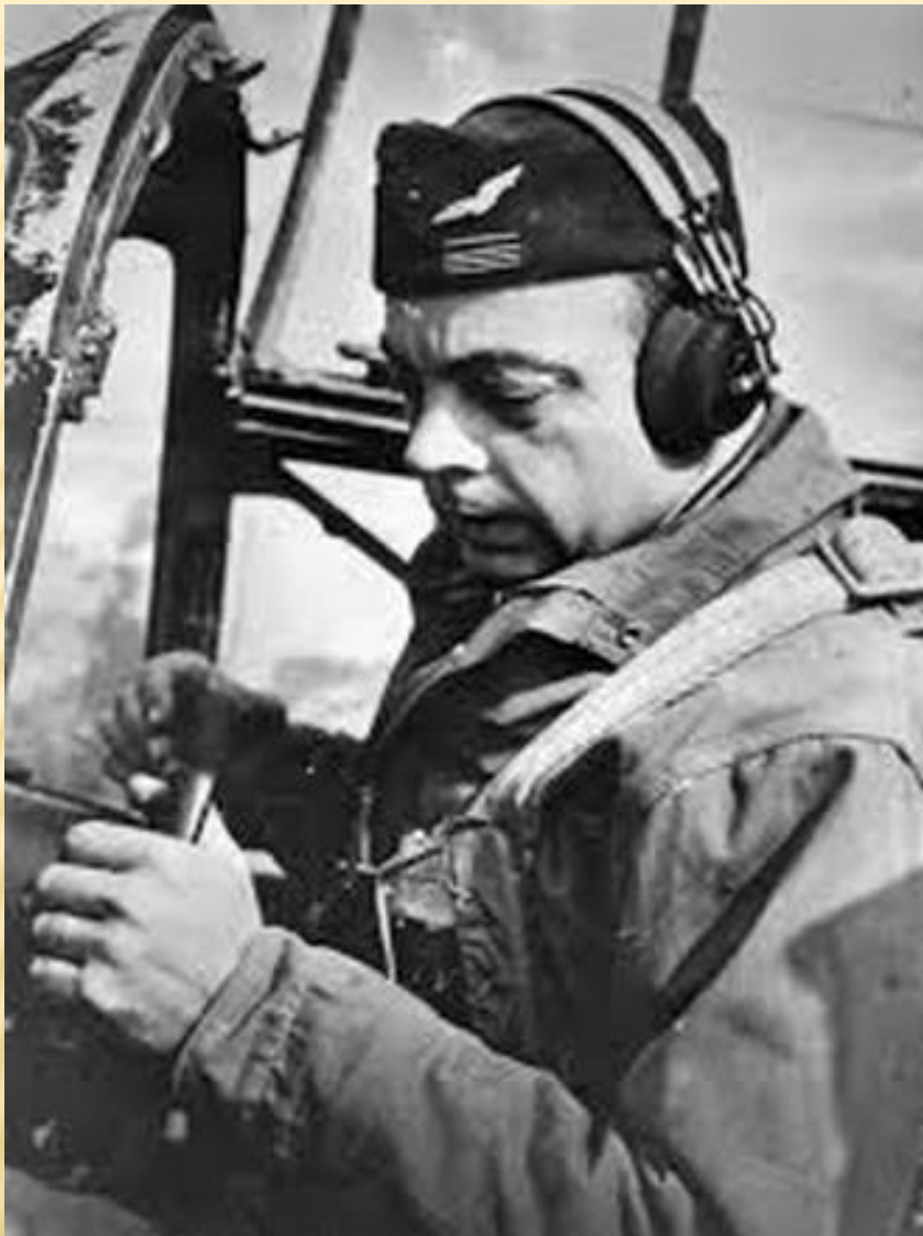
Летчик Антуан де Сент-Экзюпери

В 1929 году Сент-Экзюпери вернулся во Францию и заканчивает высшие авиационные курсы морского флота в Бресте. Летает на почтовых маршрутах, работает летчиком-испытателем, осваивает воздушные пути, в труднейших условиях испытывает новые машины... В 1934 году он подал первую заявку на изобретение новой системы посадки самолетов (всего у Экзюпери было 10 изобретений). В 1935 году во время длительного перелета из Парижа в Сайгон самолет Антуана де Сент-Экзюпери разбился в Ливийской пустыне, писатель чудом остался жив.