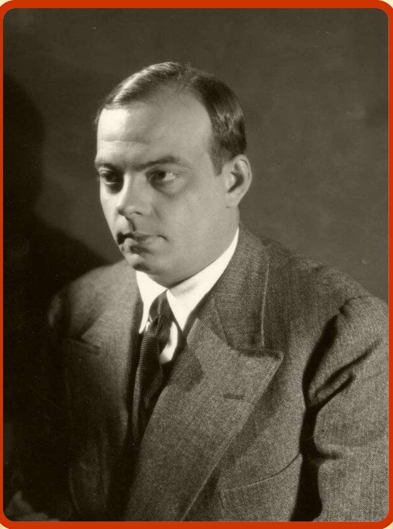
Антуан де Сент-Экзюпери

Первое произведение Экзюпери написал в колледже в 1914 году. Им стала сказка «Одиссея цилиндра». Талант автора оценили по достоинству, присудив 1 место на литературном конкурсе. В 1925 году в доме кузины Антуан познакомился с популярными авторами и издателями того времени. Они оказались в восторге от дарования молодого человека и предлагали сотрудничество. Уже в следующем году на страницах журнала «Серебряный корабль» опубликовали рассказ «Летчик». Книги Антуана де Сент-Экзюпери Произведения Экзюпери связаны с небом и авиацией. У писателя было два призвания, и он делился с публикой восприятием мира глазами пилота. Автор рассказывал о своей философии, позволявшей читателю иначе взглянуть на жизнь. Именно поэтому высказывания Экзюпери на страницах произведений сегодня используют как цитаты.