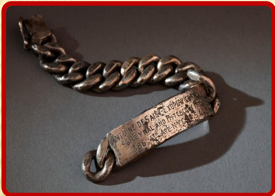
Браслет Сент-Экзюпери, найденный рыбаком близ Марселя.