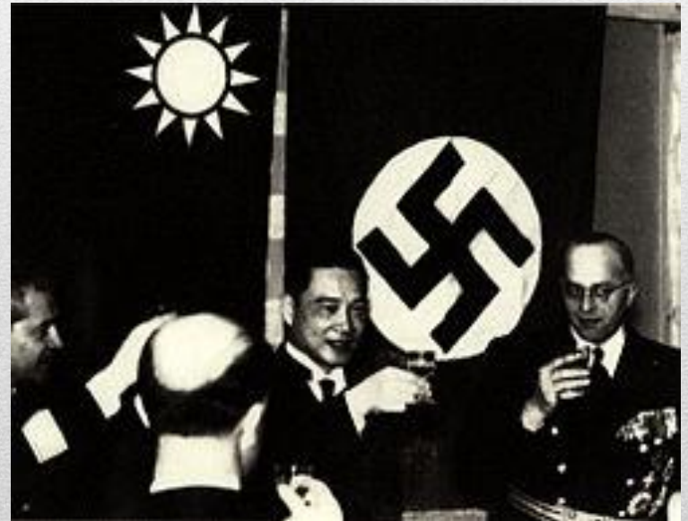
Ван Цзинвэй принимает в своей резиденции германских нацистов

«Благодарное» правительство Ван Цзинвэя в свою очередь заявляет о вступлении Китая в Тихоокеанскую войну на стороне Японии.