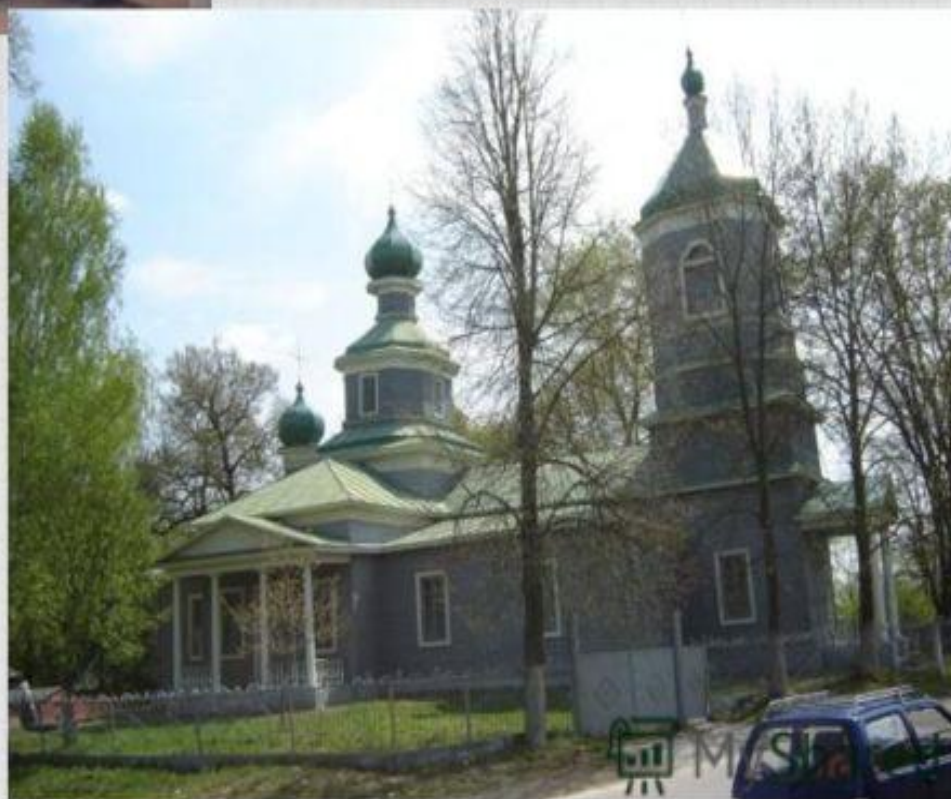
храм в Красном Рогу, возле которого расположена усыпальница Адексея Константиновича и его супруги