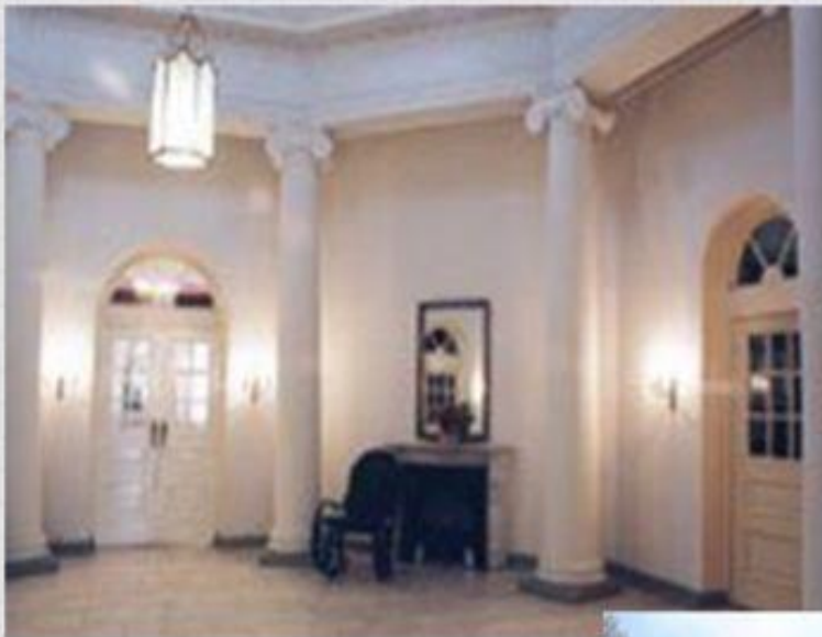
Круглый зал в Охотничьем доме