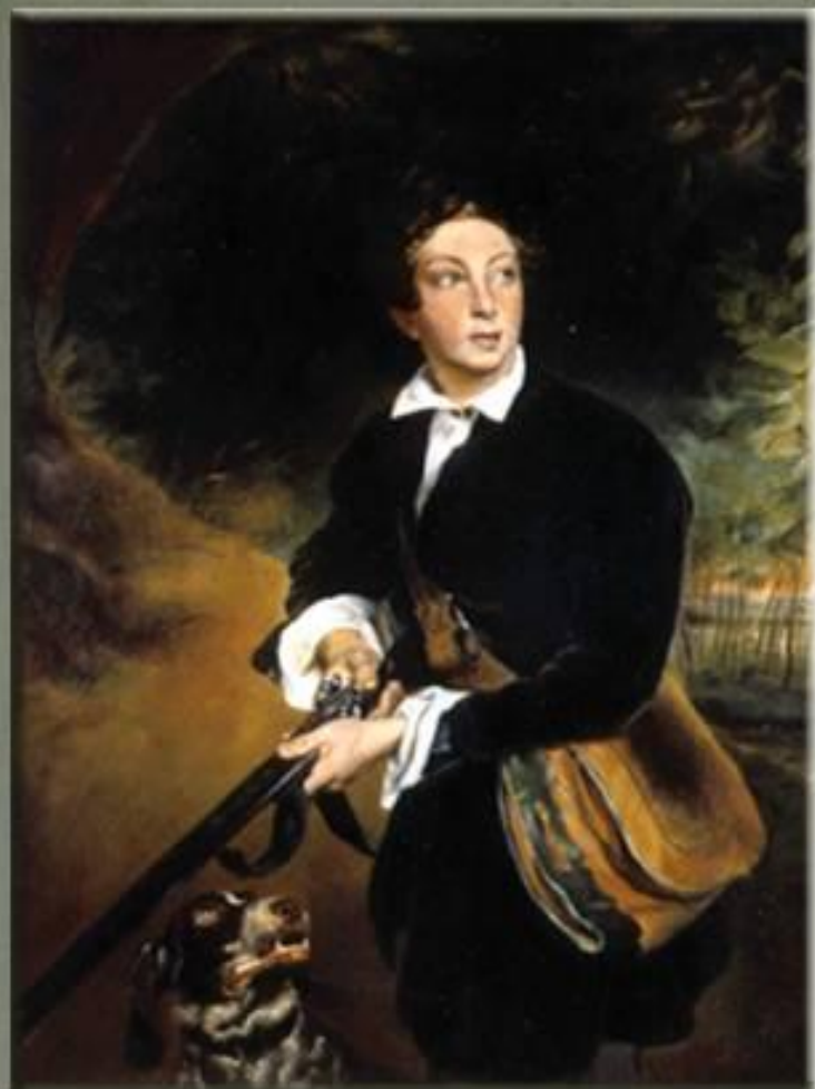
А.Толстой в юности, Худ. К.Брюллов