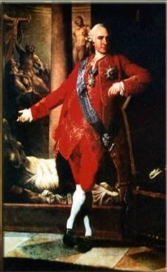
Кирилл Григорьевич Разумовский, прадедушка А.К. Толстого