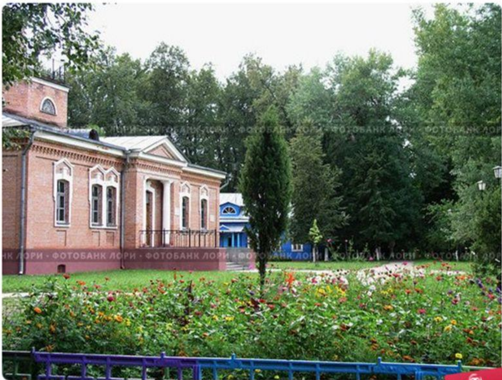
Музей-усадьба А.К. Толстого, Красный Рог