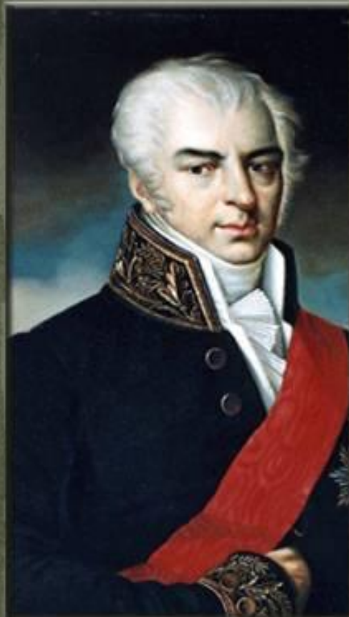
Алексей Кириллович Разумовский, дедушка А.К. Толстого