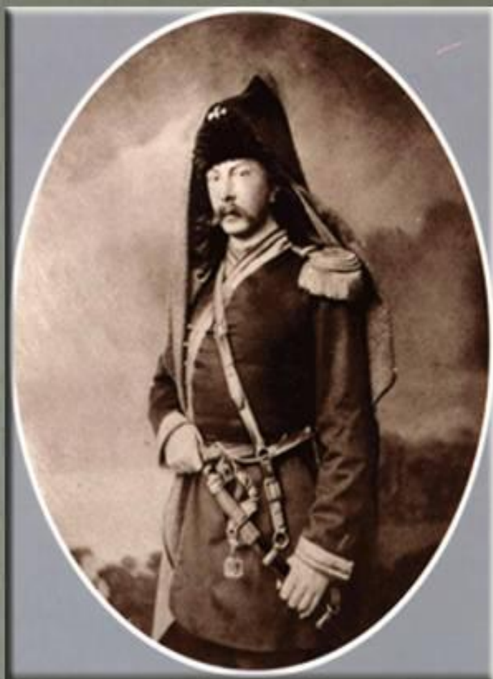
А.К. Толстой в мундире офицера Стрелкового полка, 1855 г.