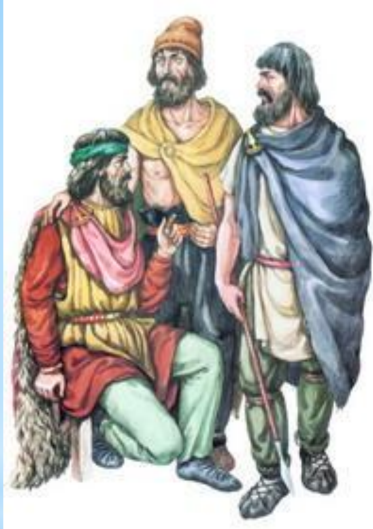
Венеди. Зарубинецька культура