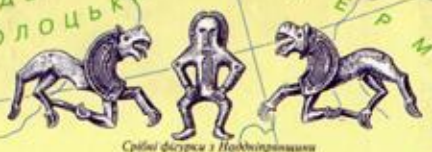
Сербські фігури з Нобдівтрини