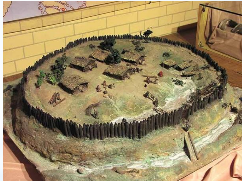
Реконструкція поселення східних слов'ян (VIII-IX ст.). Реконструкція