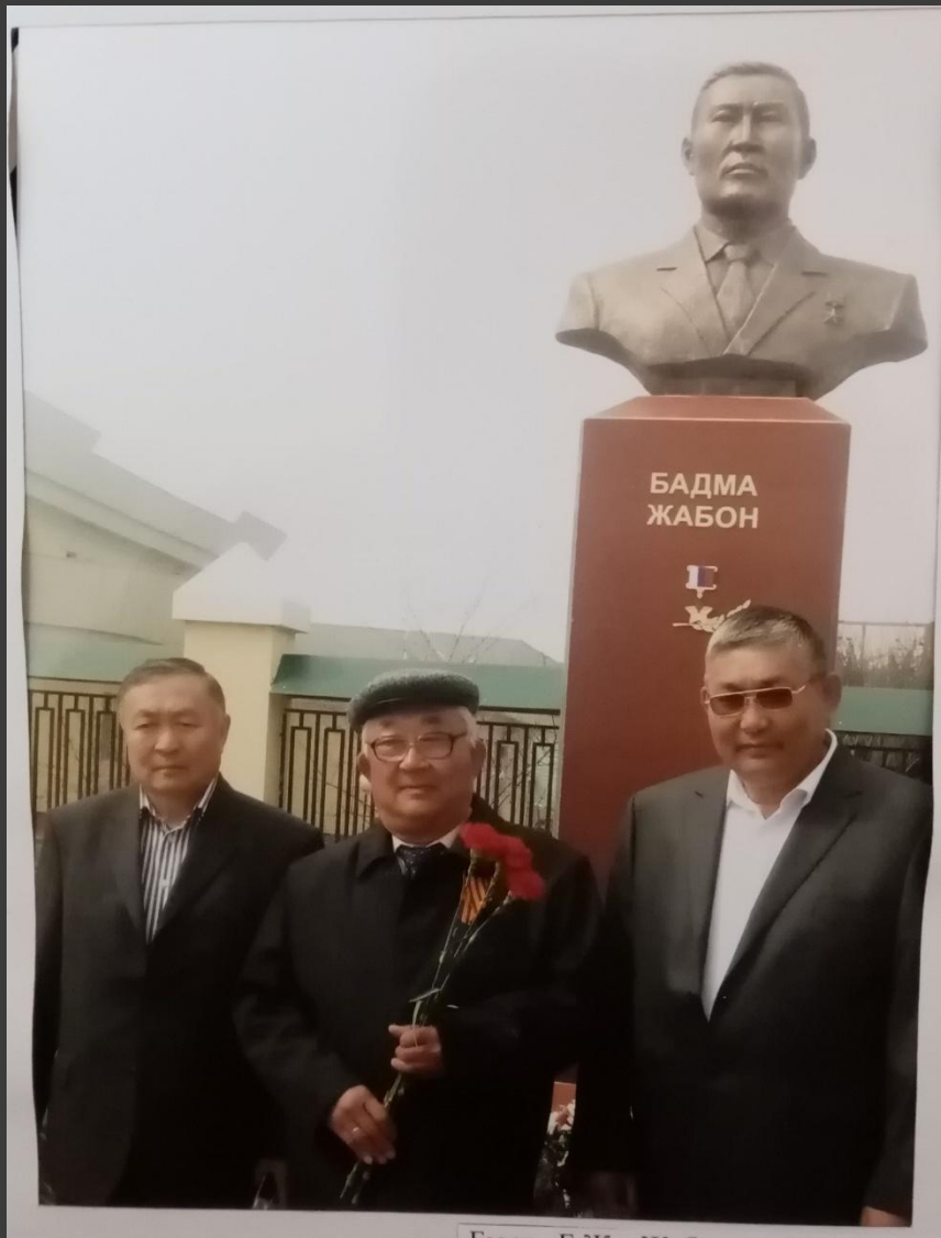
Бюст Б.Ж. Жабона на Аллее Героев в пос. Агинское (Забайкальский край)

Бюсты в честь Бадмы Жаповича Жабона открыты на Аллее героев-партизан мемориального комплекса «Партизанская поляна» в Брянске (2014), на Аллее Героев в посёлке городского типа Агинское Забайкальского края (2010), в интерактивной экспозиции «Землянка командира партизанского отряда» в военно-историческом музее Дома офицеров Забайкальского края в Чите (2018).