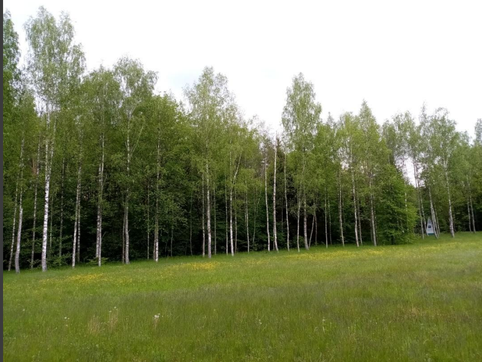
Березовая аллея, посаженная участниками Всесоюзной встречи партизан и подпольщиков на Партизанской поляне

Его воспоминания об этой поездке сохранились на аудиозаписи, сделанной Агинским радиовещанием.