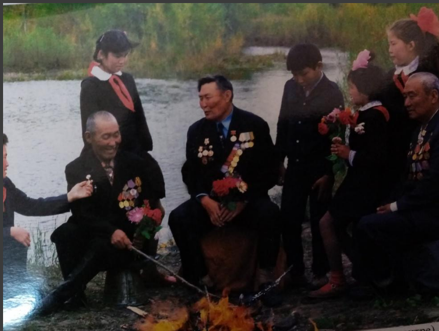
Бадма Жапович Жабон на встрече с школьниками в Забайкалье. 1976 г.

Вспоминают бывшие школьники, которым выпала честь общаться с живой легендой: «Запомнилось, как он рассказывал, как подрывал вражеские эшелоны, как они подбирались [к ним], как они очень сильно охранялись. Как они долго лежали в снегу чуть ли не сутками».