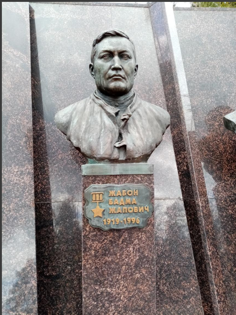
Бюст. Жабон Бадма Жапович, Аллея Героев, Мемориальный комплекс «Партизанская Поляна»

1 января 2019 года исполнилось бы 100 лет Бадме Жаповичу Жабону легендарному партизану с позывным «Монгол» – одному из организаторов партизанского движения на Брянщине.