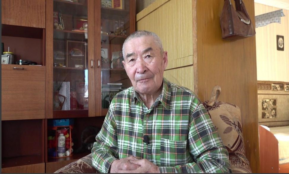
Б.Ж. Жабон. 1990-е гг.

Указом Президента Российской Федерации № 1071 от 20 июля 1996 года за мужество и героизм, проявленные в борьбе с немецко-фашистскими захватчиками в Великой Отечественной войне 1941-1945 годов, Жабону Бадме Жаповичу присвоено звание Героя Российской Федерации с вручением знака особого отличия – медали «Золотая Звезда».