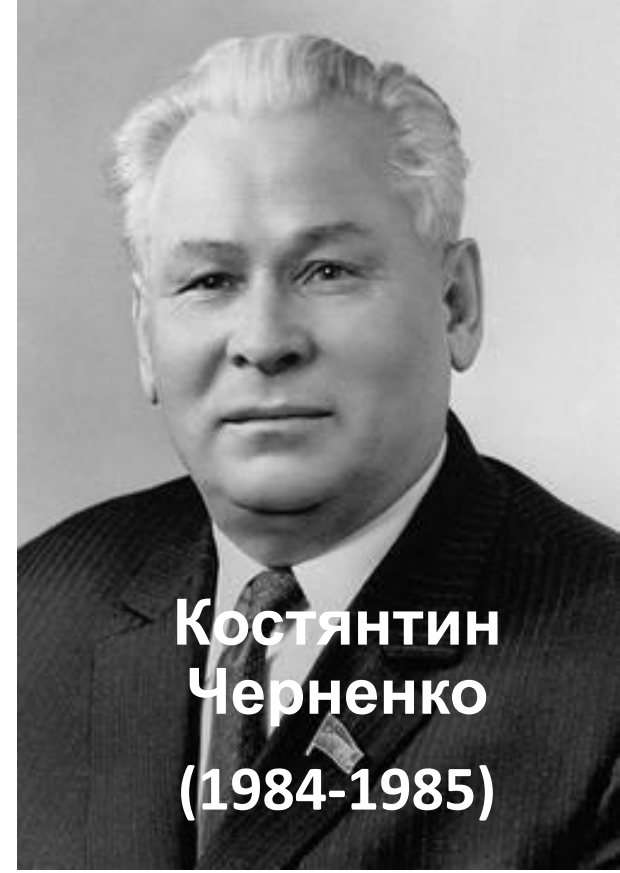
Костянтин Черненко (1984-1985)

Обидва керівники обіймали найвищі посади в похилому віці, хворіли й невдовзі вмирили. Це посилювало в людей відчуття абсурду при владі. Падіння відчувалося на всіх рівнях.