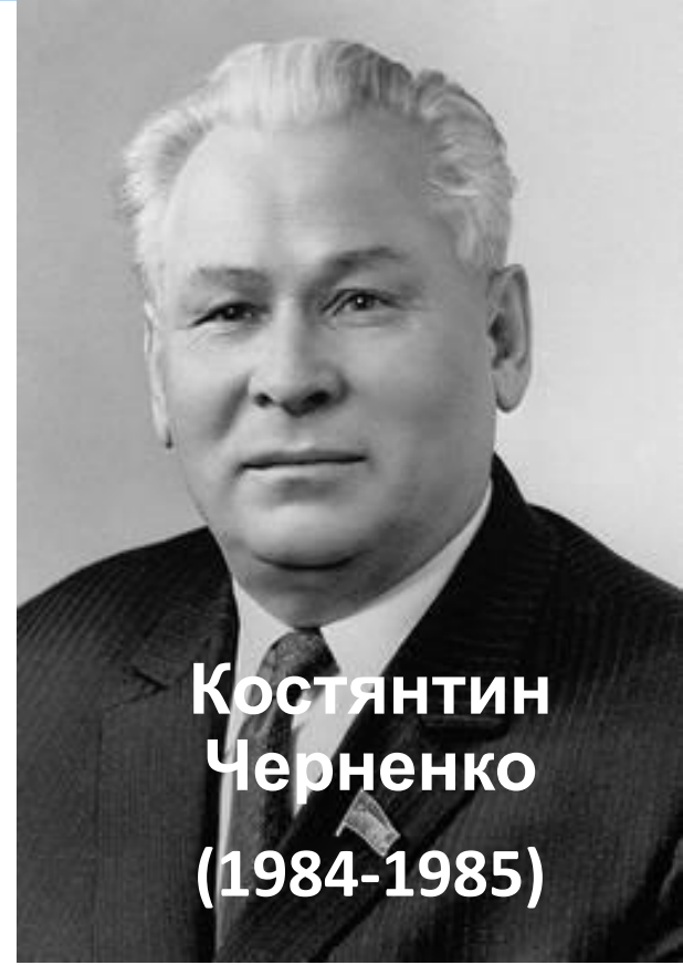
Костянтин Черненко (1984-1985)

Обидва керівники обіймали найвищі посади в похилому віці, хворіли й невдовзі вмирили. Це посилювало в людей відчуття абсурду при владі. Падіння відчувалося на всіх рівнях.