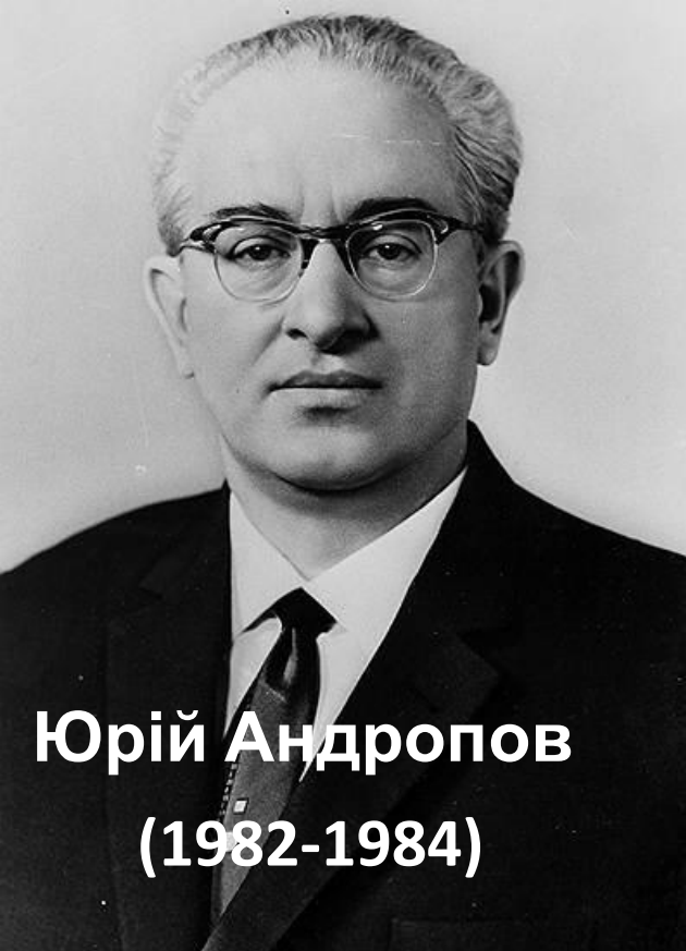
Юрій Андропов (1982-1984)