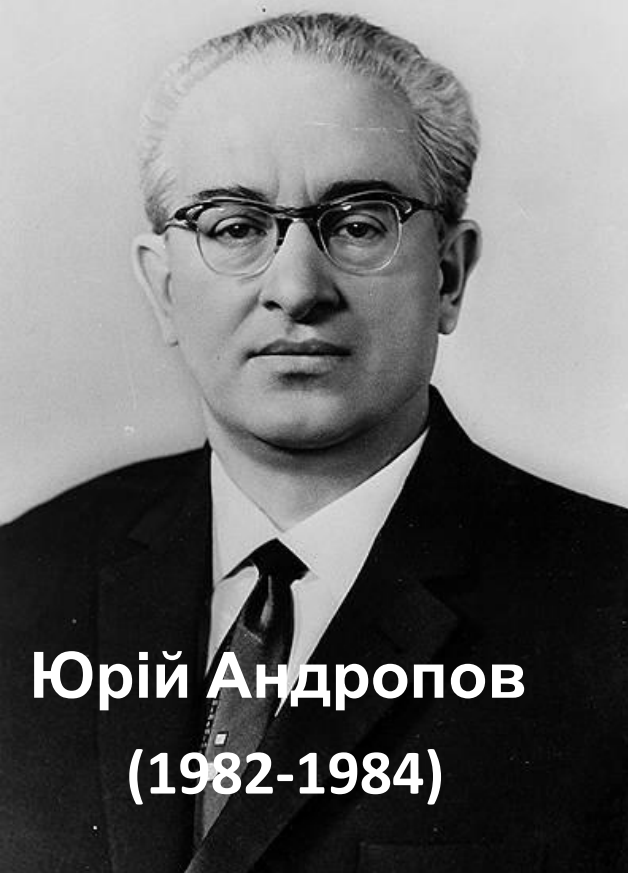
Юрій Андропов (1982-1984)