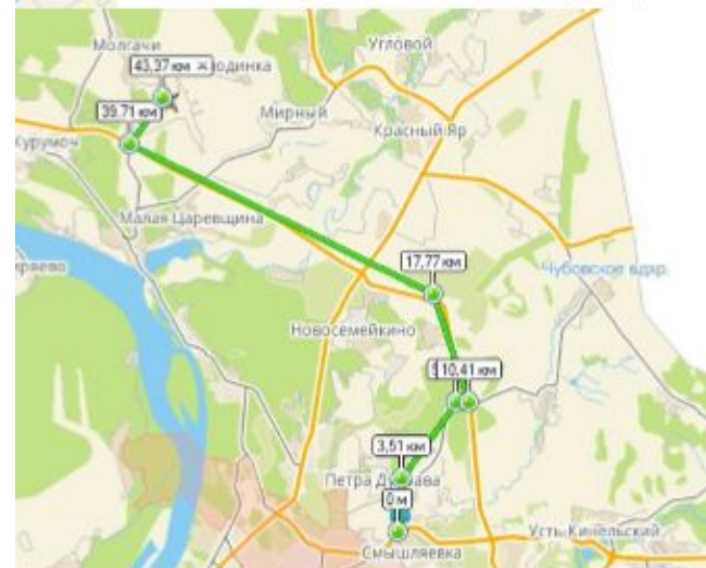
Рис. 3 Инфраструктура и местоположение Самарского подразделения ООО «Тевекс»