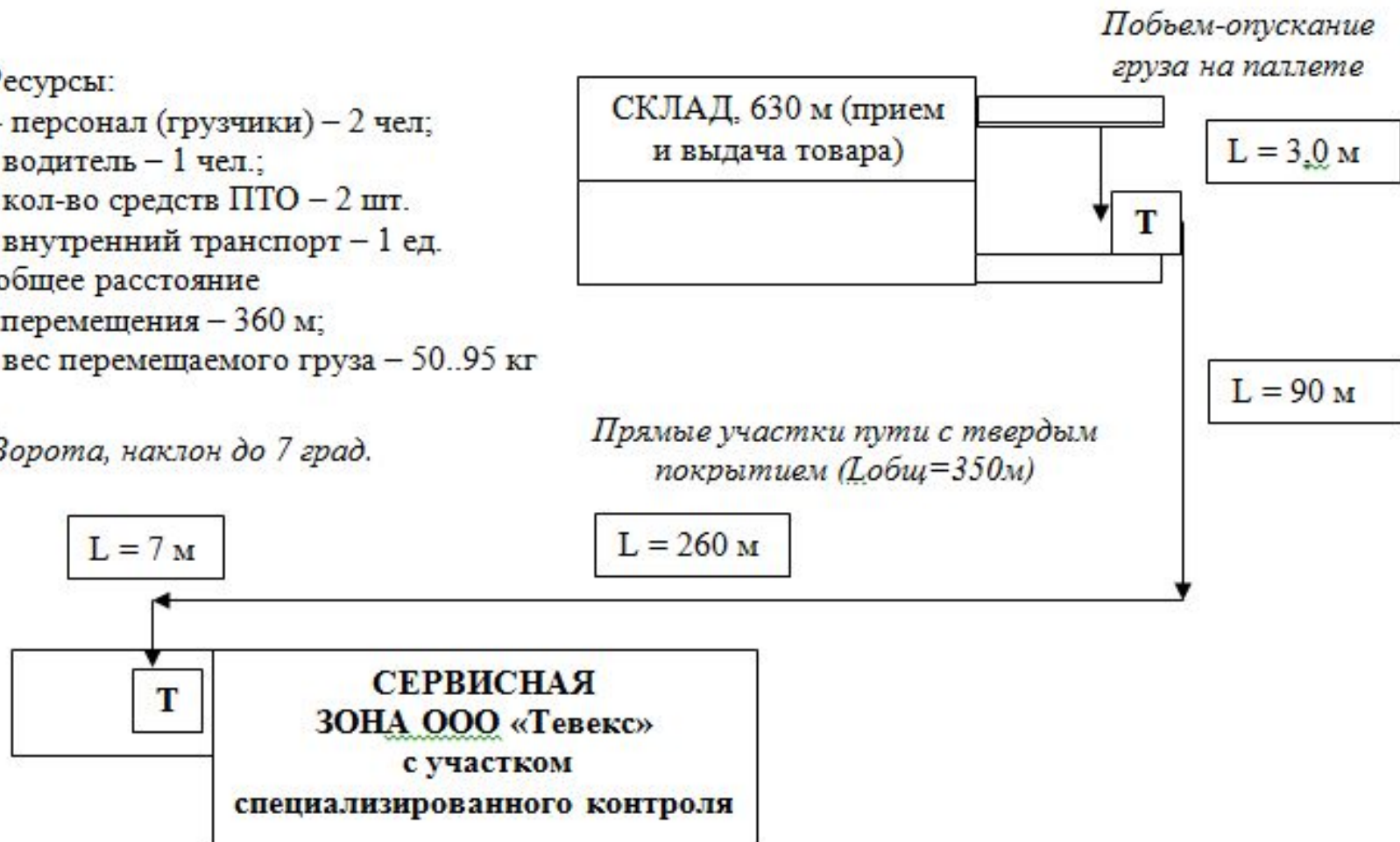
Рис. 3 Схема операции перемещения компонентов в ООО «Тевекс» на инструментальный контроль (существующий вариант)