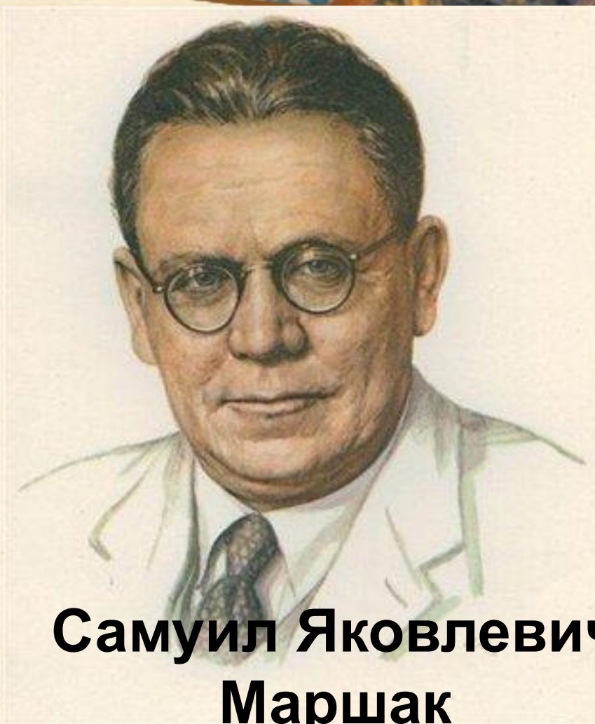
Самуил Яковлевич Маршак