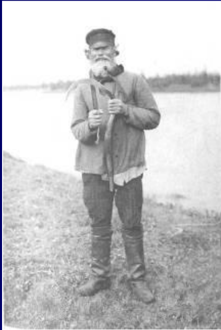
Фото начала XX в.

Разрешение выхода крестьян из общины с правом закрепления в частную собственность принадлежавших им земельных наделов в форме отруба или хутора