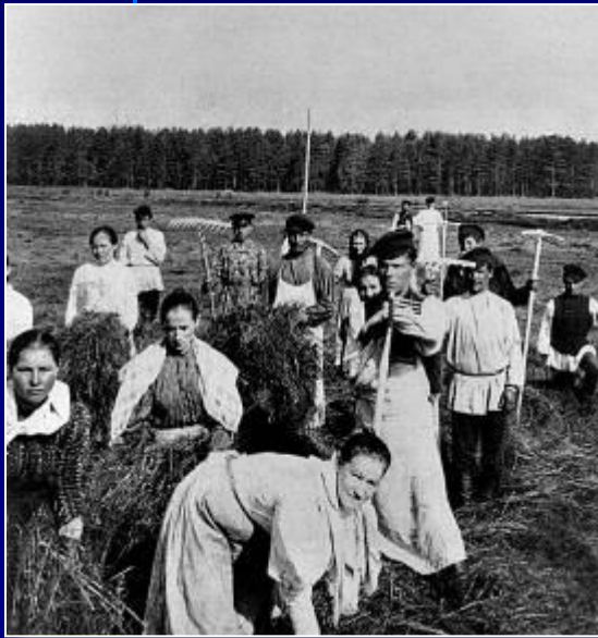
Фото начала XX в.

Начало разрушения общины. К 1916 г. из общины вышло 25-27% крестьянских дворов