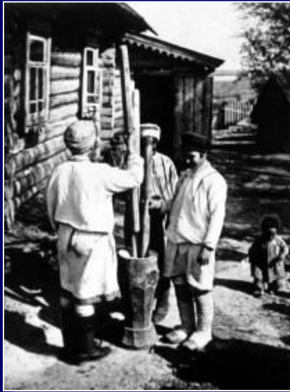
Фото начала XX в.

Незначительные временные сроки проведения реформ