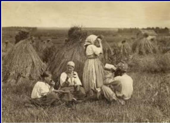
Фото начала XX в.

Создание класса земельных собственников как социальной опоры самодержавия и противника революционного движения