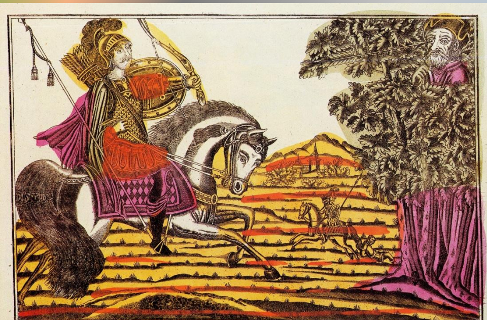
ВЫПЪЖАЕТЪ СИЛЬНЫЙ ХРАБРЫЙ БОГАТЫРЬ ИЛЯ МУРОМЕЦЪ изъ Чернигова прямо на Киевъ, и подъяезжаетъ къ Бран- севымъ лѣсамъ къ болотамъ топкимъ и буйнымъ лѣсамъ на двѣнадцати дубахъ живъ Соловей-Разбойникъ, некроукалъ онъ выконнаго ни пѣша- го Разбойничьимъ цосристомъ, вѣтъ увидѣлъ Соловей-Разбойникъ Илью муромца засмѣялся онъ недопуская 20 вер. потому става сѣ- стать громче прежнего недопусти къ себѣ верста онъ на 10", и Илья Муромца кони спотыкается, допуститъ къ самому гнезду Славъ свистать онъ что есть мочи, вѣтъ слымактъ съ нѣтъ Илья тусой дука на кладѣхъ болкну стрѣлу пунактъ и даже разъ попалъ Соловейю Разбойнику въ правый глазъ, Разбойникъ съ гнѣва свалился какъ обвалины снопъ