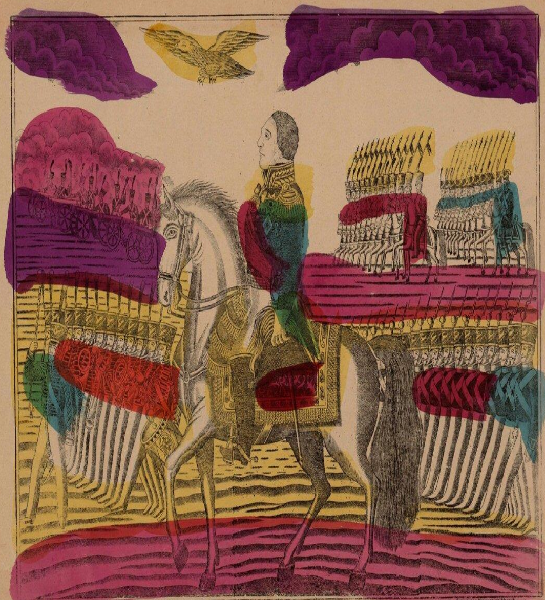
ГЕНЕРАЛЪ ФЕЛЬДМАРШАЛЪ КНЯЗЬ ГОЛЕНИЦЕРЪ ВУТУЗОВЪ СМОЛЕНСКІЙ