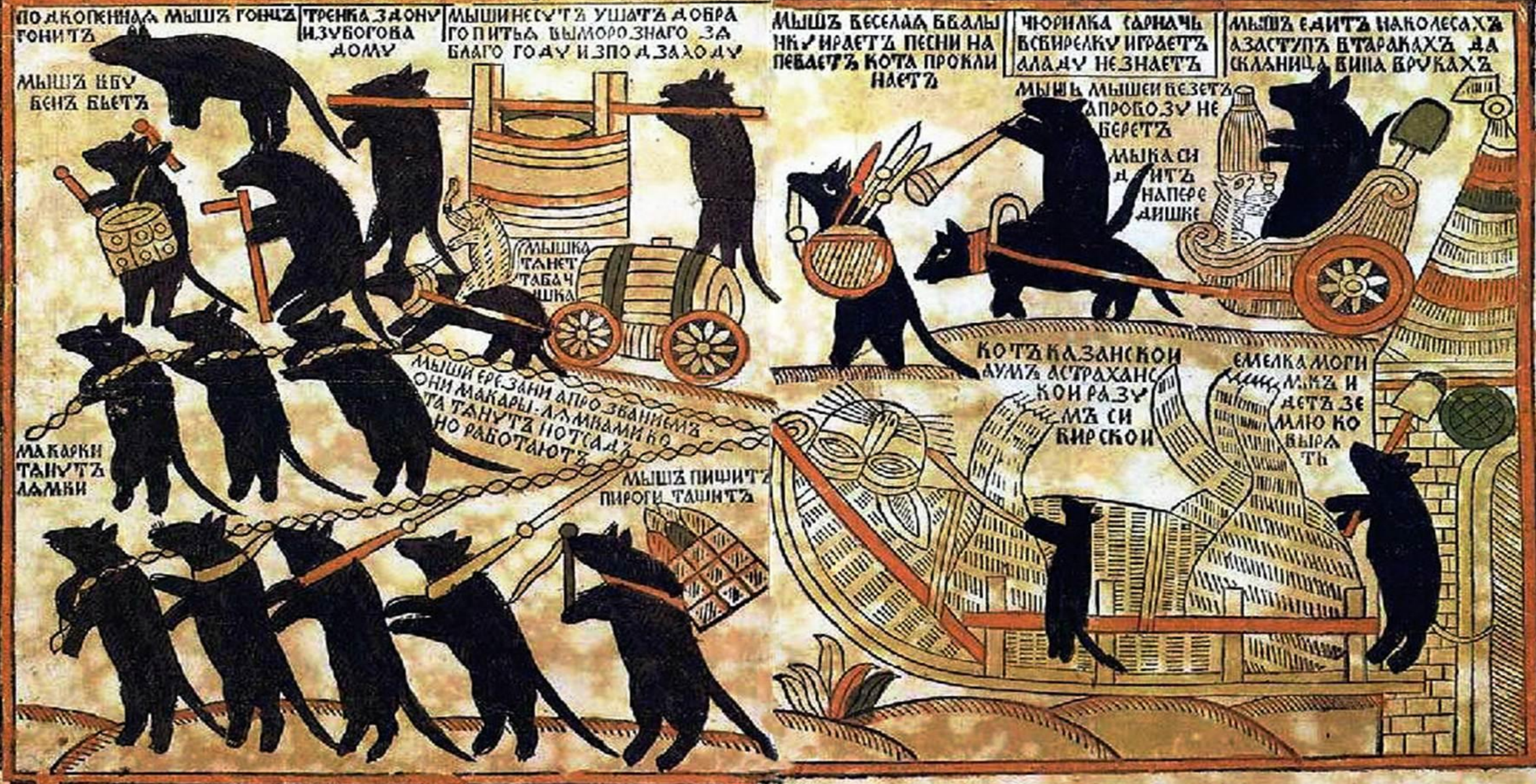
Мыши кота погребают.