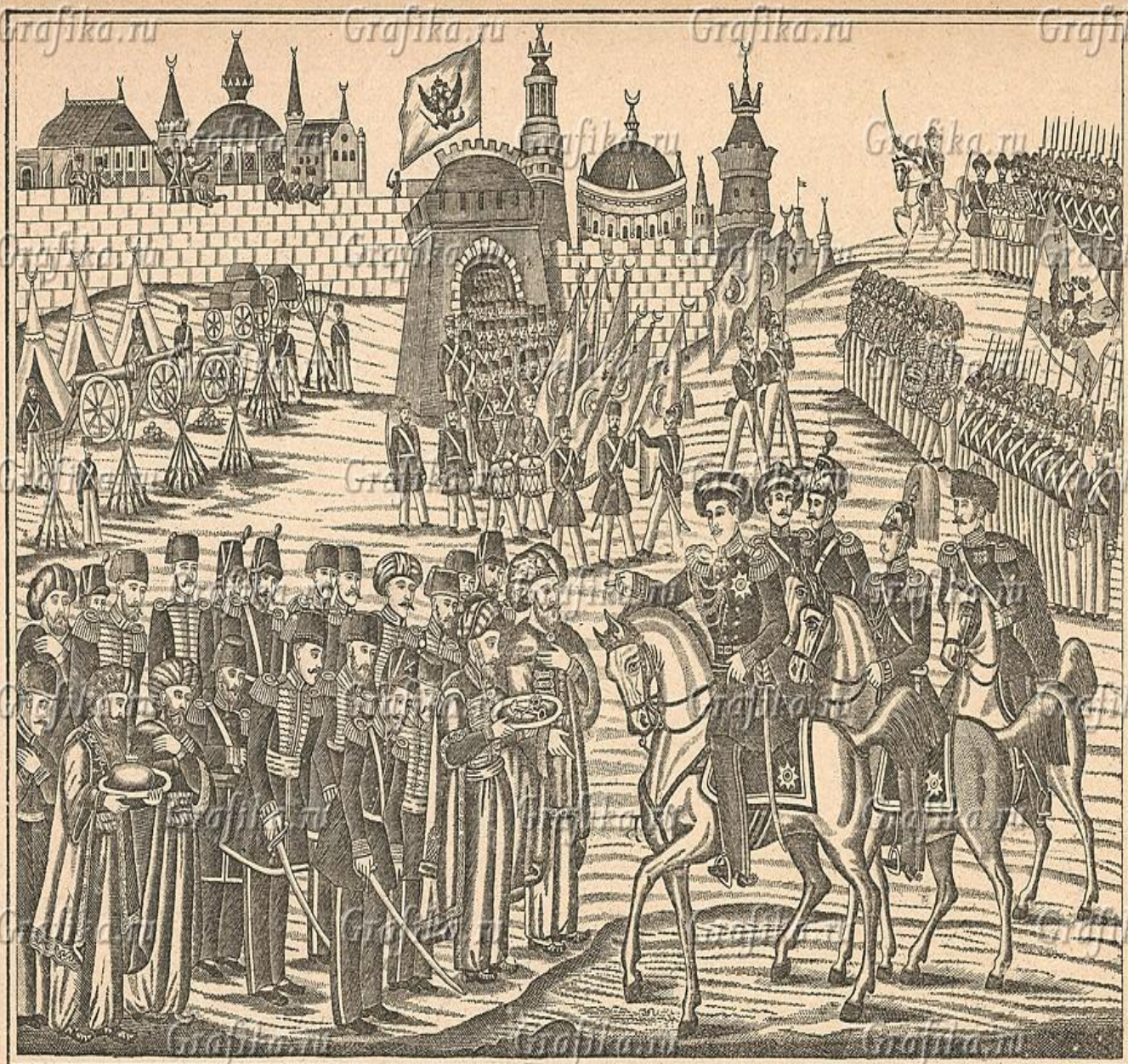
СДАЧА ГОРОДА И КРѢПОСТИ КАРСА 16 го НОЯБРЯ 1855 го ГОДА.

Гдѣ побѣдоносныя Русскія войска подъ предводительствомъ Главнокомандующаго Отдѣльнымъ Кавказскимъ корпусомъ Генерала Адмирала Мухоморова взяли въ плѣнъ Турецкаго Мушера Главнокомандующаго Анатолійскаго арміею Мамедъ-Вассифъ Пашу, съ нимъ еще 80 пленныхъ, много Штандартъ и Оверъ-Общеровъ, а также Анатолійскаго Генерала Вильямса съ всѣмъ имуществомъ. Въ крѣпости взято 120 тысячъ пшеницы и большіе склады оружія и множество знаменъ.