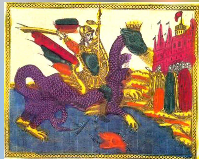
СЛАВНЫЙ СИЛЬНЫЙ И ХРАБРЫЙ ВИТЯЗЬ ЕРУСЛАНЪ ЛАЗАРКВИЧЪ ѣдетъ на Чудо великомъ Змѣи ОТРЕХЪ ГЛАВАХЪ: а Прекрасная Царевна Анастасія Вохрамеевна встречаетъ его.