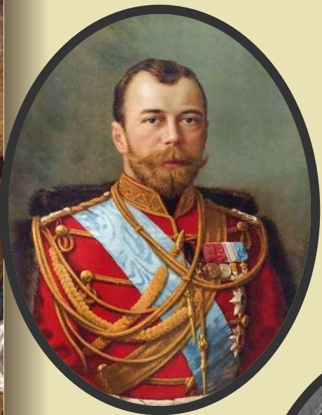
Ренненкампф Павел Карлович фон 1854-1918 генерал- адъютант