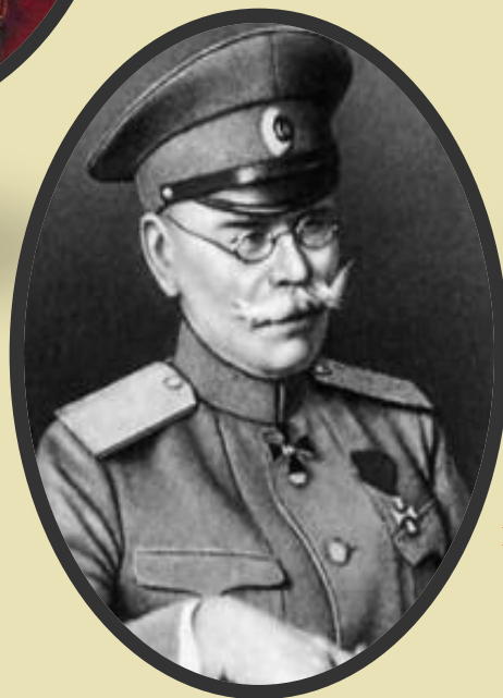
Великий князь Николай Николаевич Верховный Главкомандующий всеми сухопутными и морскими силами Российской Империи в начале Первой мировой войны (1914—1915)