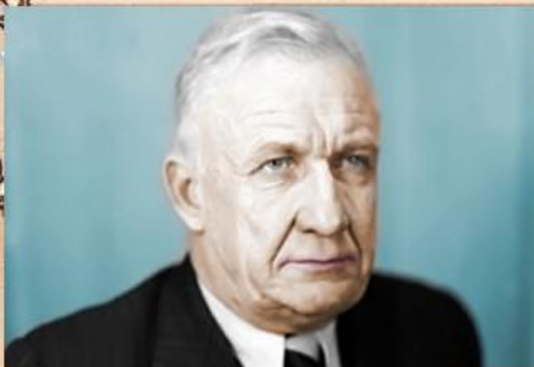
Игорь Евгеньевич Тамм (1895 – 1971) Советский физик –теоретик, академик АН СССР

В конце 1944-го А.Д.Сахаров поступил на заочное отделение аспирантуры Физического института академии наук СССР им. П. Н. Лебедева (ФИАН), а в начале 1945 года перевелся на очное отделение. Научным руководителем молодого ученого стал Игорь Евгеньевич Тамм. Спустя три года Сахаров защитил кандидатскую диссертацию. Его учитель Игорь Евгеньевич Тамм настоял, чтобы Сахаров работал над темой "Теория ядерных сил".