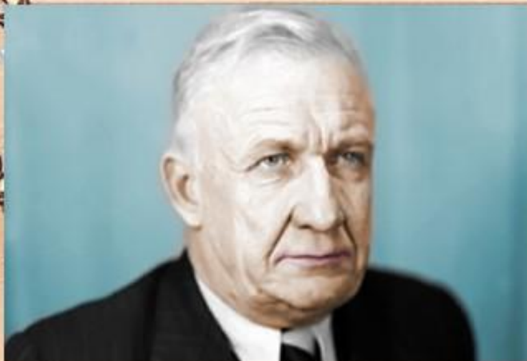
Игорь Евгеньевич Тамм (1895 – 1971) Советский физик –теоретик, академик АН СССР

В конце 1944-го А.Д.Сахаров поступил на заочное отделение аспирантуры Физического института академии наук СССР им. П. Н. Лебедева (ФИАН), а в начале 1945 года перевелся на очное отделение. Научным руководителем молодого ученого стал Игорь Евгеньевич Тамм. Спустя три года Сахаров защитил кандидатскую диссертацию. Его учитель Игорь Евгеньевич Тамм настоял, чтобы Сахаров работал над темой "Теория ядерных сил".