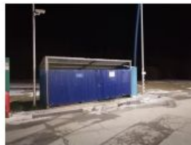
Место происшествия (АЗС/площадка ТКО)

Правило № 9 «Если чувствуете себя плохо, не приступайте к работе – обратитесь к врачу»