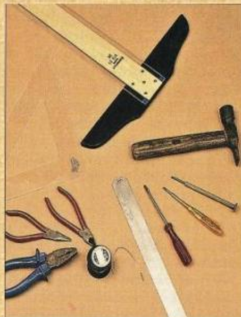
Пассатижи, наковальня, кусачки, отвёртки, молоток, линейки