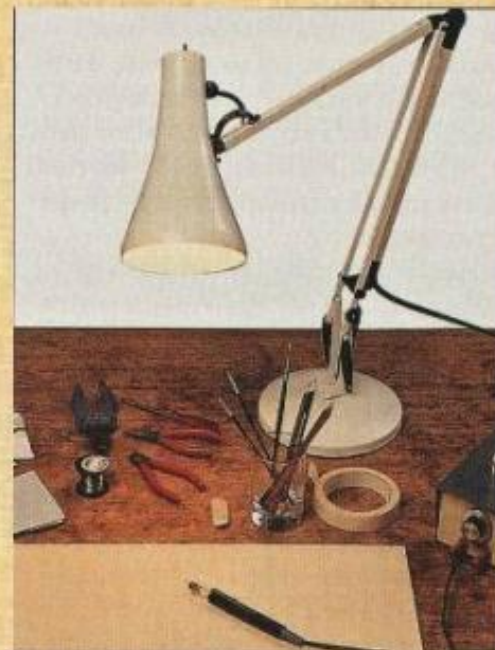
Настольная лампа, карандаши, точилка, ластик, копировальная бумага, кисточки, краски, рисунок