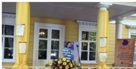
«Твоя профессия — твой выбор!»