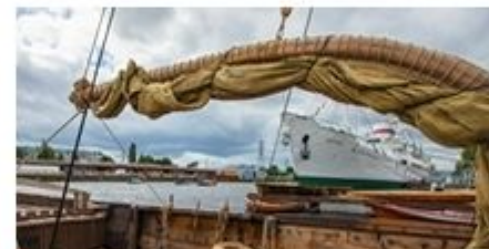
«Морским судам быть!»