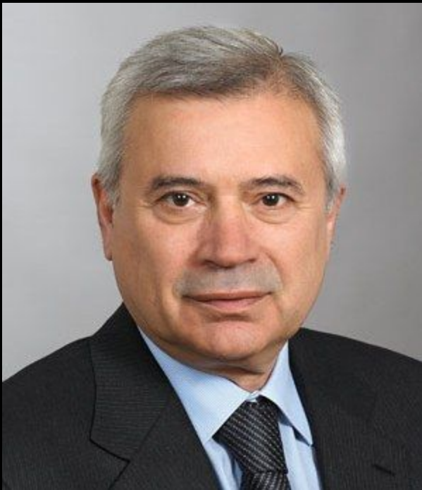
Вагит Алекперов — главный нефтяной магнат России, основной акционер «Лукойла», крупнейшей частной нефтяной компании России.

«ЛУКОЙЛ за четверть века прошел исторический путь от отечественной нефтяной вертикально интегрированной компании до крупного участника мирового энергетического рынка. Во все времена и при любых условиях мы руководствуемся простой логикой: людям разных стран для нормальной жизни, прежде всего, нужны еда, тепло, возможность передвигаться. Мы умеем и знаем, как это обеспечить, сохранив баланс интересов общества, акционеров и каждого сотрудника Компании. Составляющими нашего развития являются: опыт поколений, технологический прогресс, экономическая стратегия и социальная ответственность. Мы верны своему девизу — «ЛУКОЙЛ — всегда в движении!» »