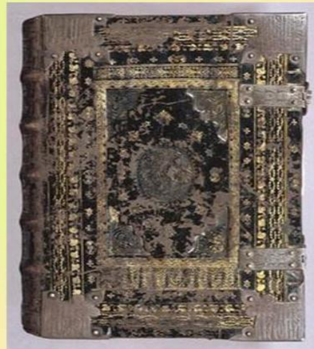
Так выглядели первые книги