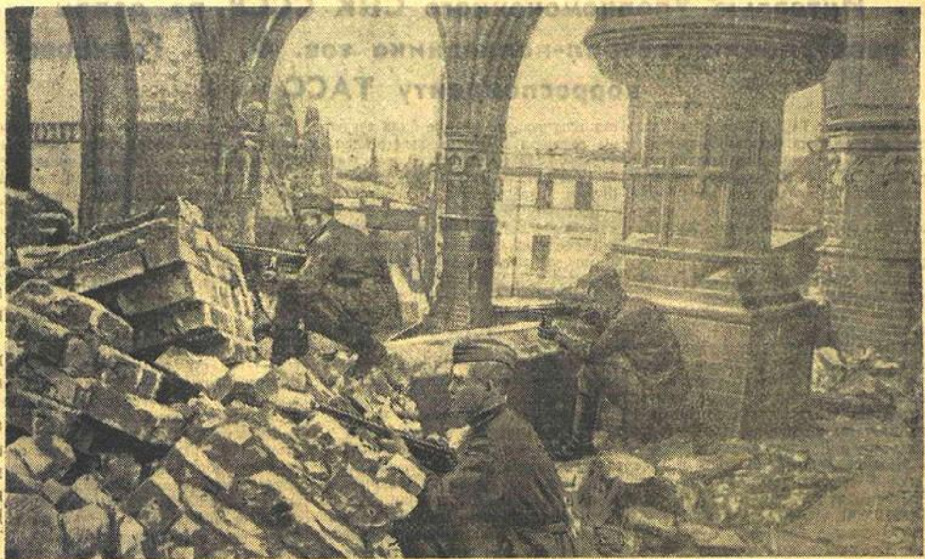
ВЧЕРА В БЕРЛИНЕ. Советские воины продолжали громить врага в центре германской столицы. (Доставлен на самолете летчиком старшим лейтенантом Савченко).