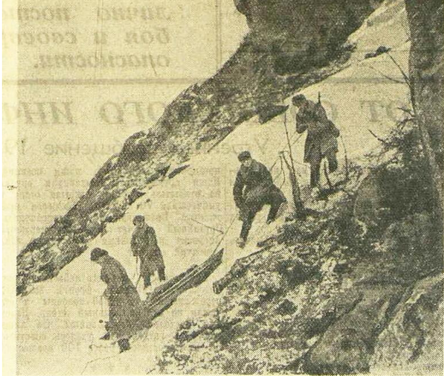
НА КРАЙНЕМ СЕВЕРЕ. Перевозка раненого.