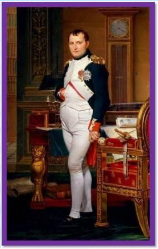
Наполеон I Бонапарт