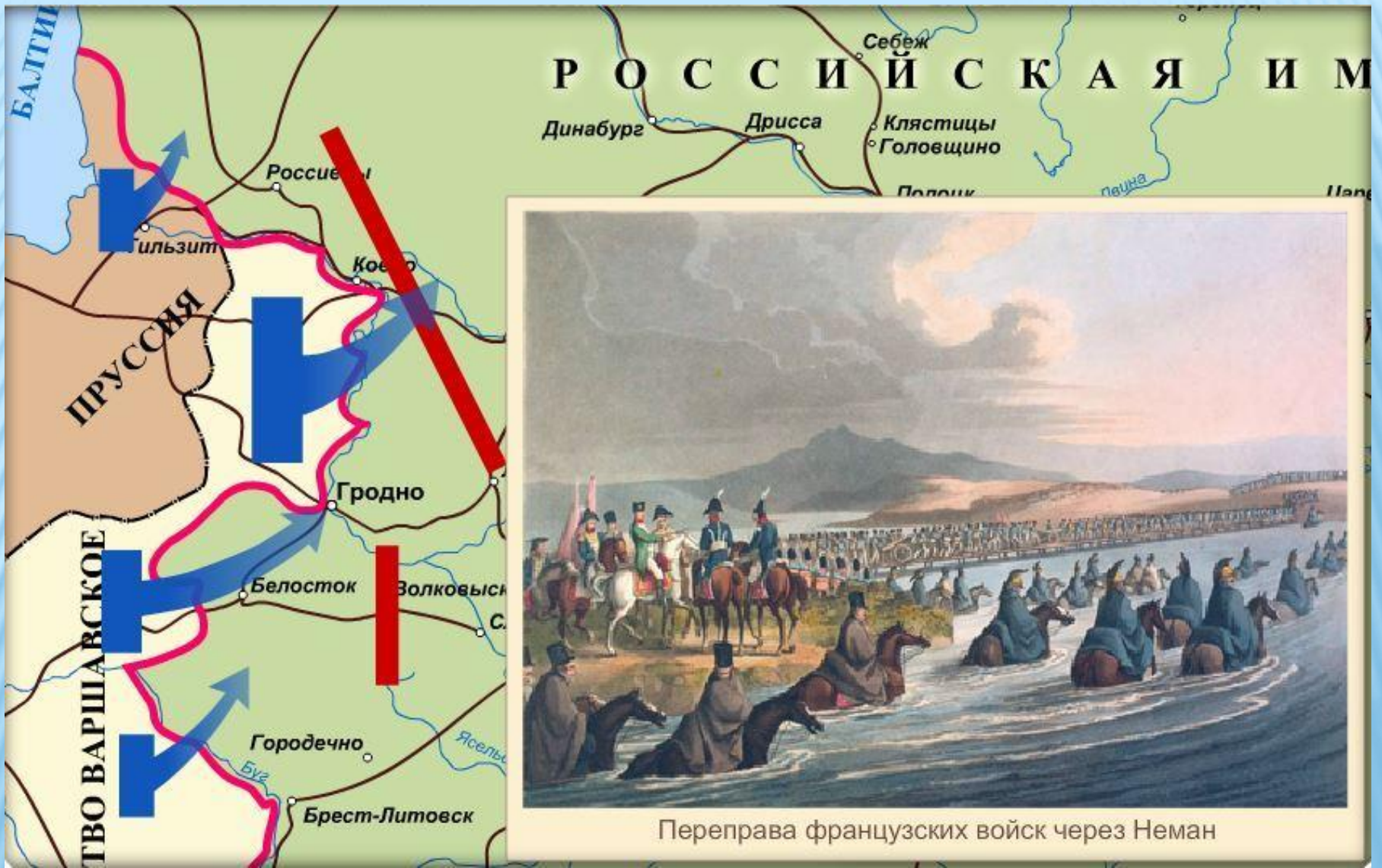
Наступление французской армии.