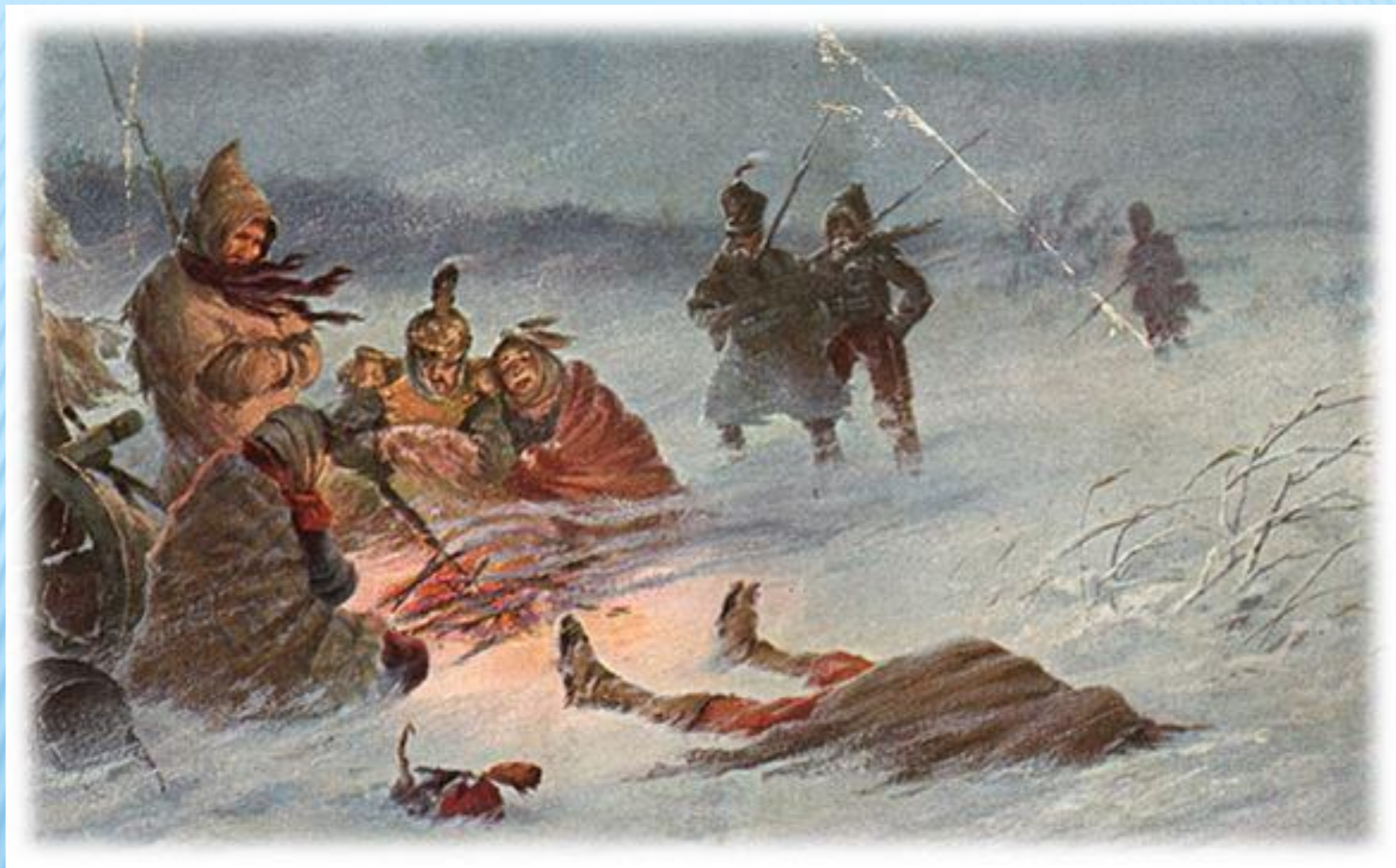
Отступление великой армии.