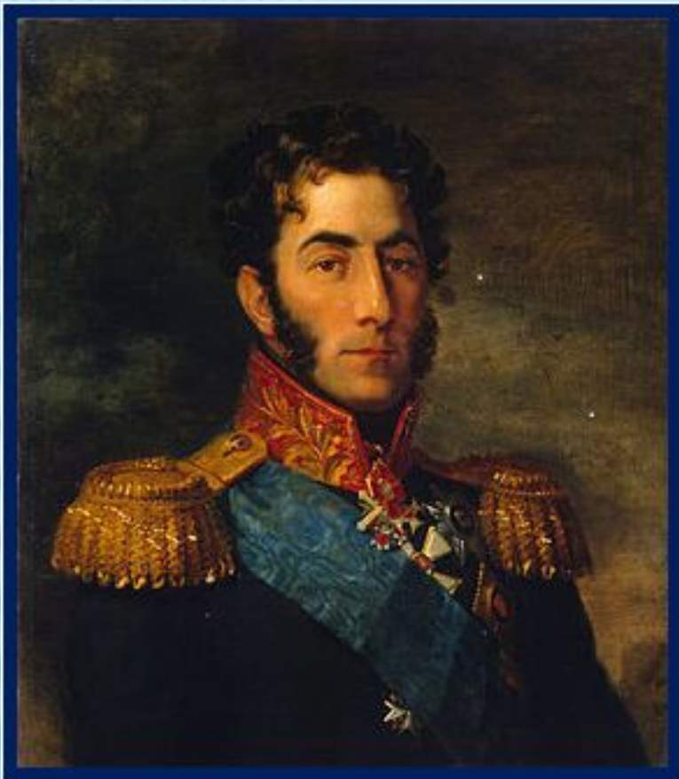
Пётр Иванович Багратион