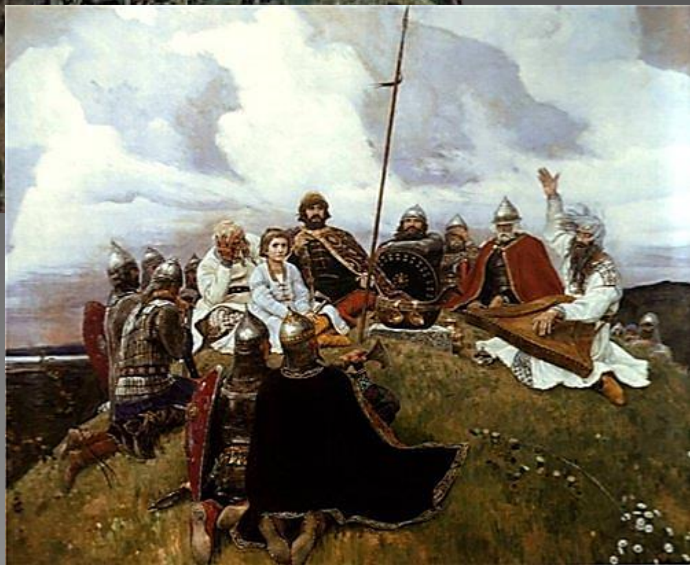
Васнецов Виктор Михайлович