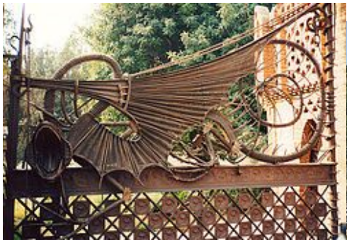
Ворота-дракон в павильонах виллы Гуэль (1887)