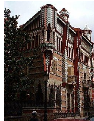
Дом Висенс (1888)