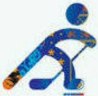
Хоккей на льду