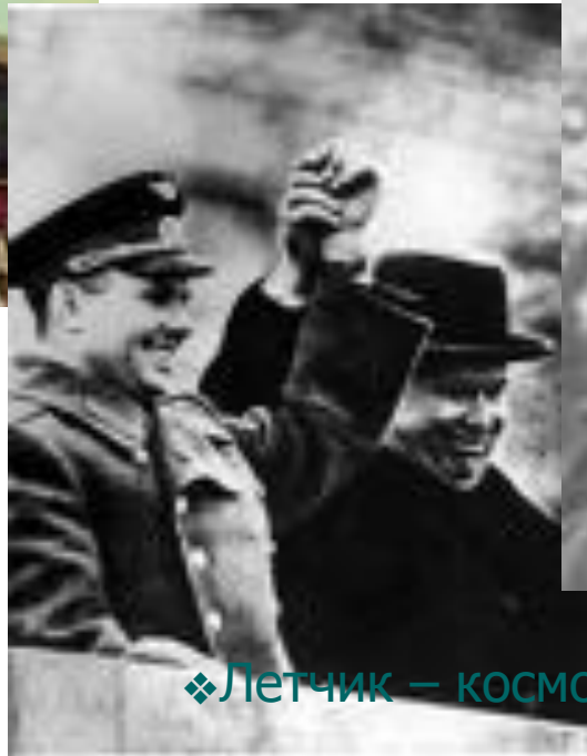
❖ Летчик – космонавт СССР Ю.А.Гагарин