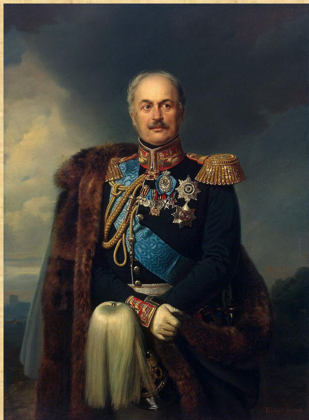
Павел Дмитриевич Киселев (1788—1872)

1836 г.: создание пятого отделения собственной Его Величества канцелярии, его главой назначен П.Д.Киселев.