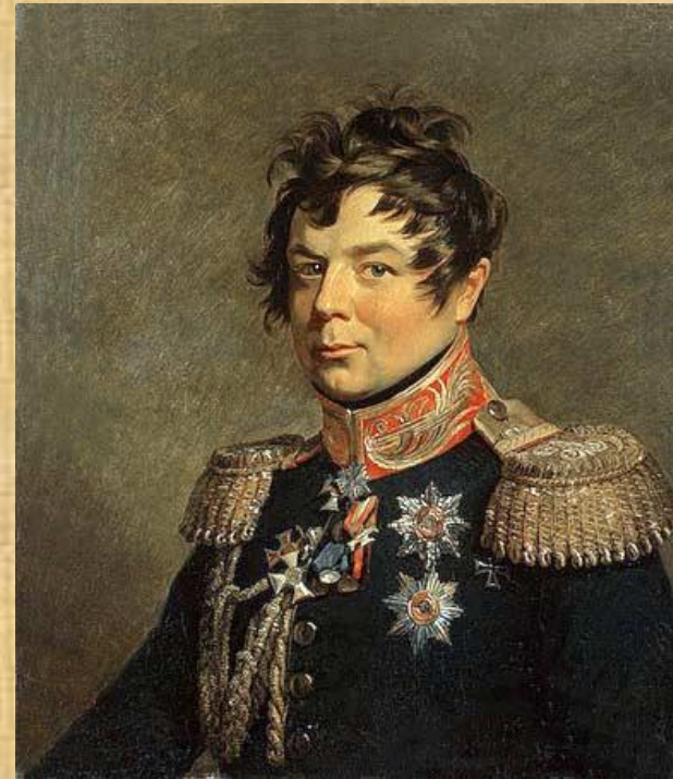
Генерал-фельдмаршал Иван Дибич- Забалканский