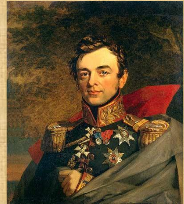
Генерал-фельдмаршал Иван Паскевич