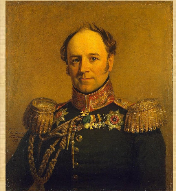
А.Х.Бенкендорф, Главный начальник III отделения

«Нет сомнения, что крепостное право, в нынешнем его положении у нас, есть зло, для всех ощутительное и очевидное, но прикасаться к нему теперь было бы делом еще более гибельным» (Николай Первый, 1842 г.)