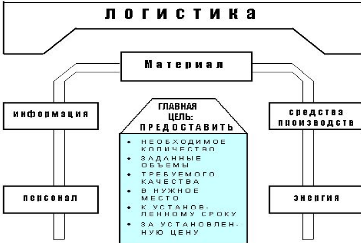
Рис . 2. Общепринятые цели логистической деятельности Шесть правил логистики (6 richtig)