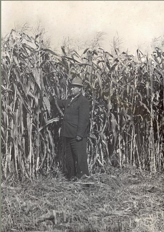
На кукурузном поле.