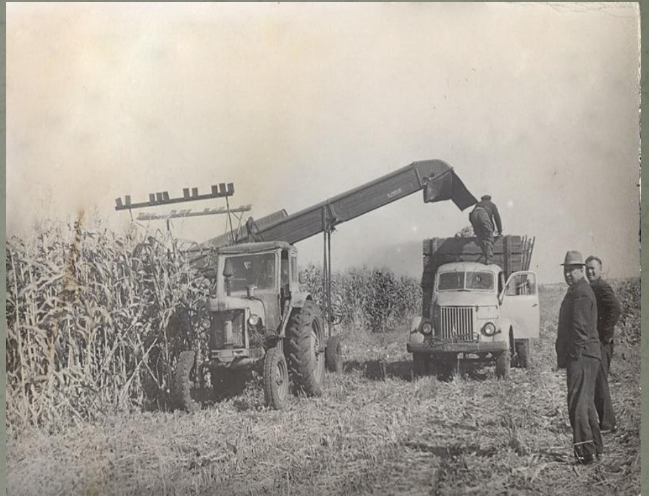
Уборка кукурузы на силос.