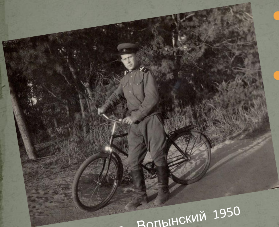
Город Новоград – Волынский 1950 г.