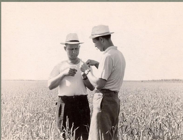
На опытном поле с-за «Октябрь» Подсчет зерен в колосе.