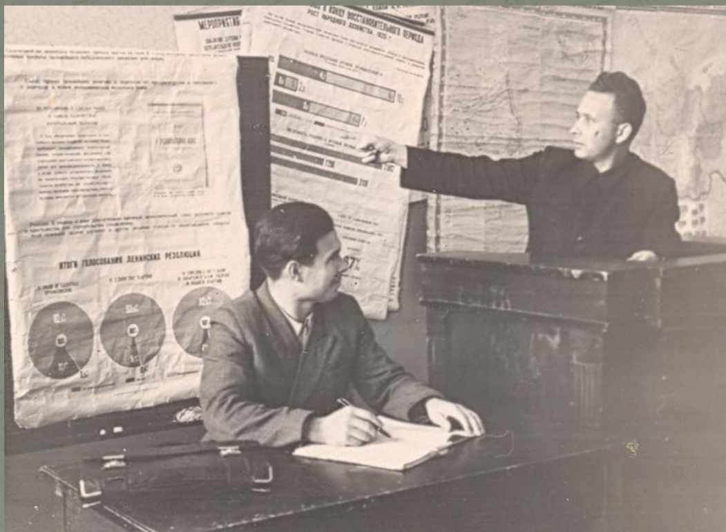
Учеба в Совпартшколе.