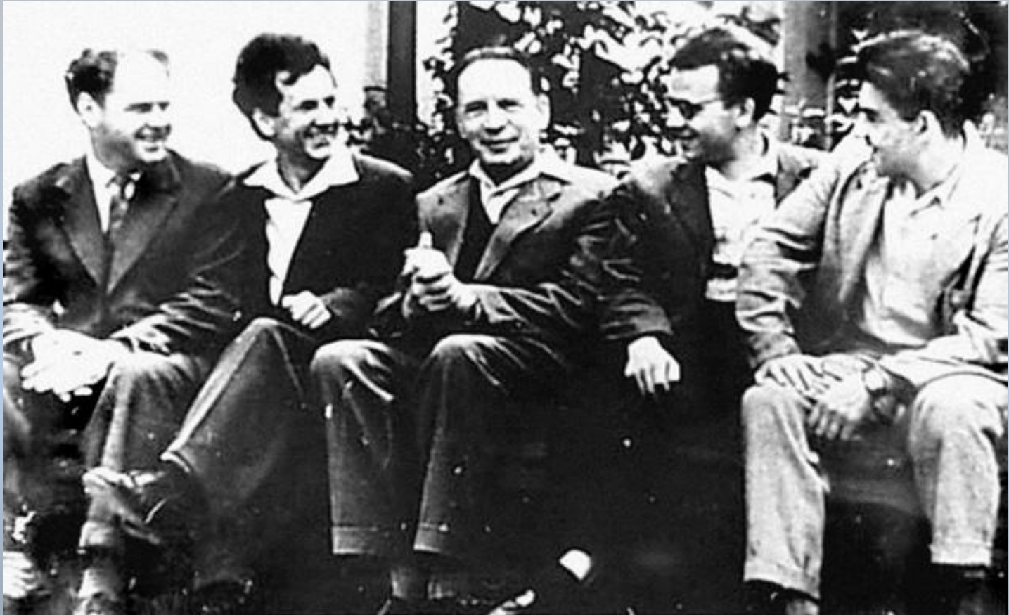
Александр Леонидович Чижевский и калужские литераторы в июле 1961 года

Учёный и изобретатель, поэт, художник и философ, он ещё при жизни заслуженно именовался “Леонардо да Винчи XX века”.