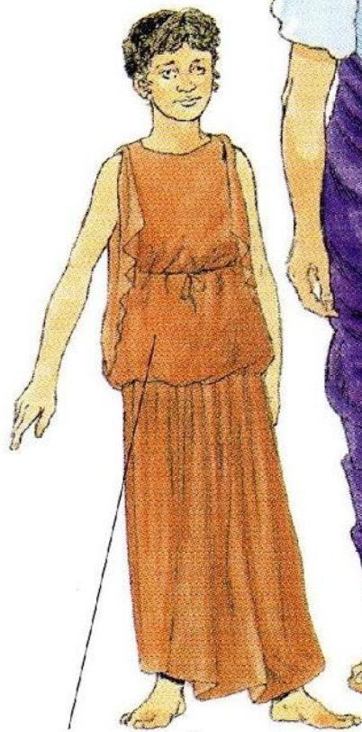
Туника, подпоясанная на бёдрах и талии

Справа типичная римская семья. Римлянки (как и гречанки) должны были покрывать голову, выходя из дома.