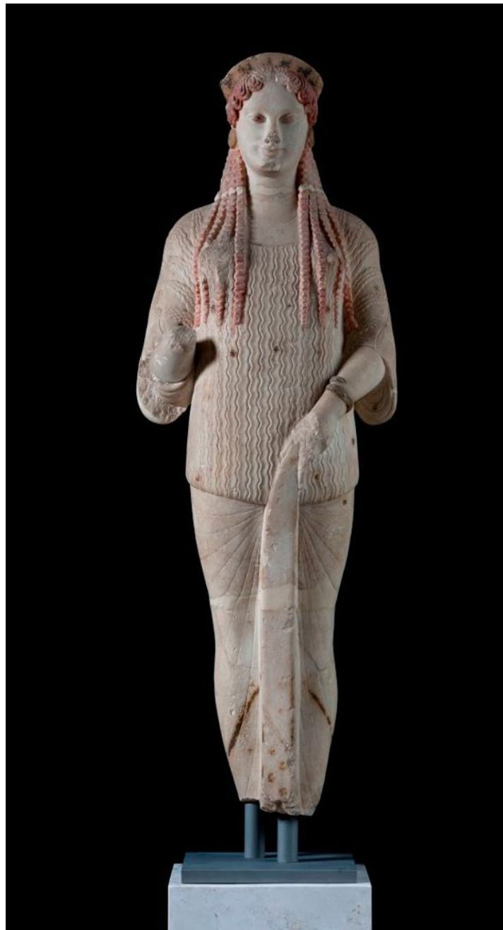
Статуя коры. VI в. до Н. э.