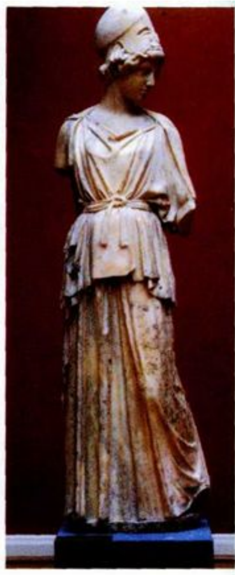
Мирон. Афина (из композиции с двумя фигурами «Афина в споре с Марсием»), V в. до н. э.