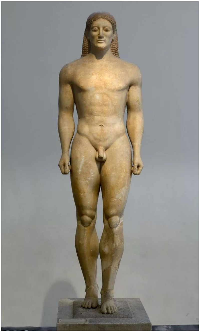
Статуя куроса. VI в. до Н. э.