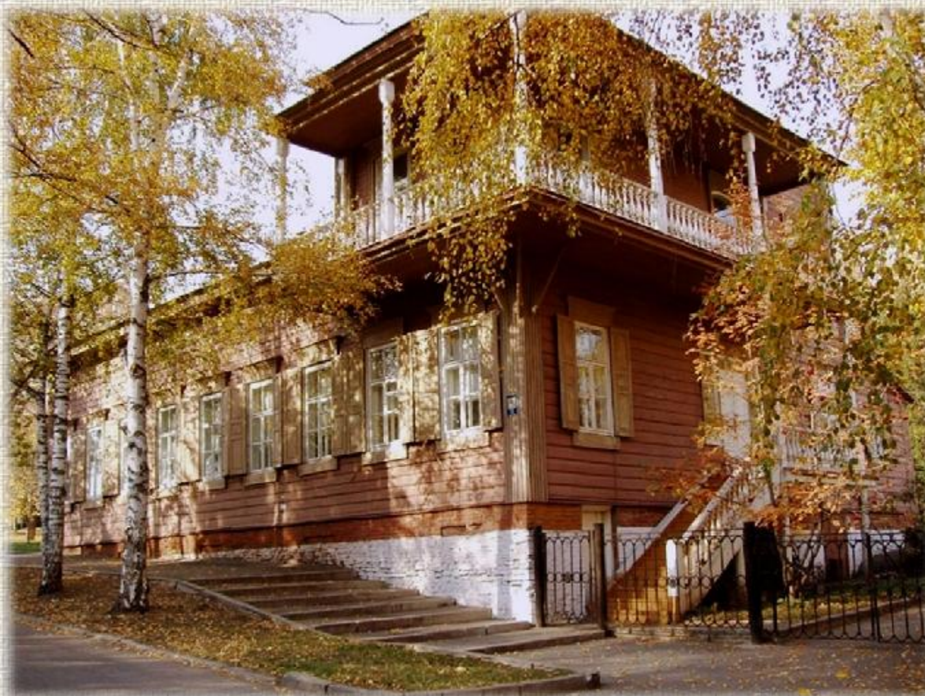
Мемориальный дом-музей С.Т. Аксакова в Уфе