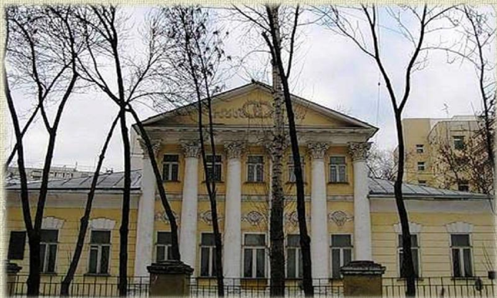
Дом С.Т.Аксакова в Москве