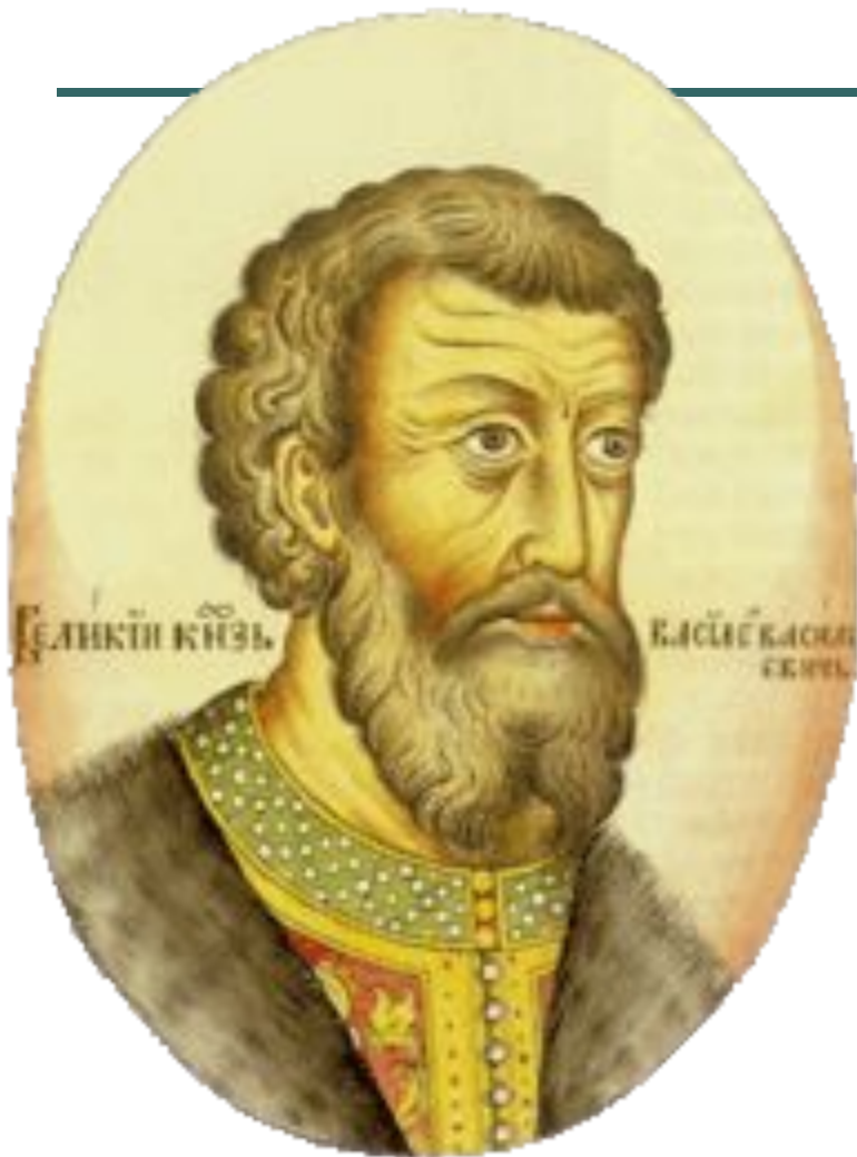
Василий II Темный