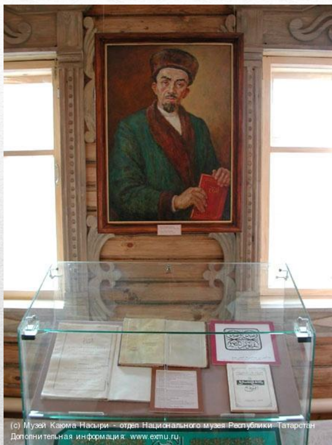
Дополнительная информация: www.exmu.ru