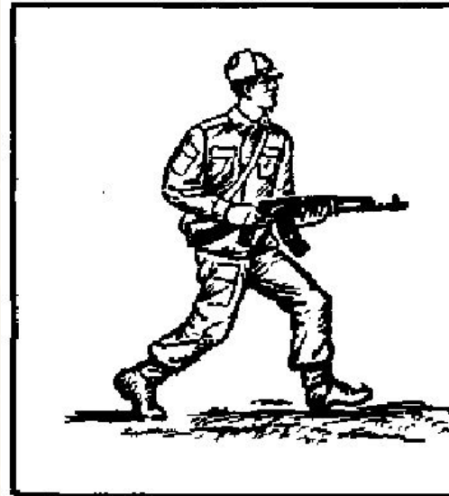
Мал. 147. Повільний біг