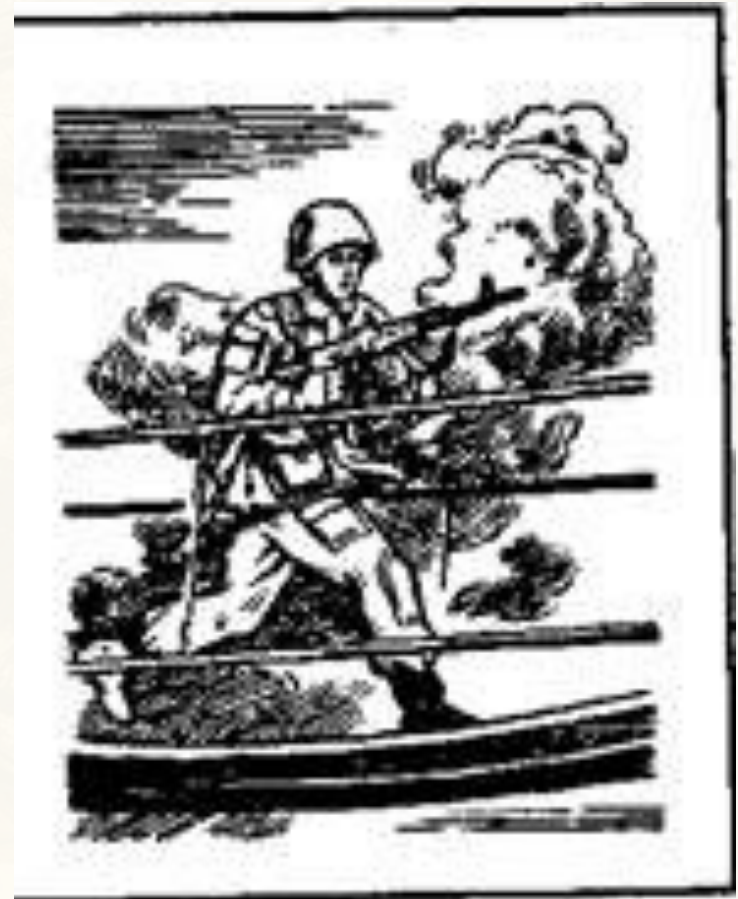
Мал. 141. Бір