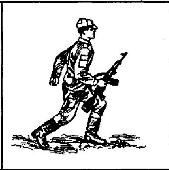
Мал. 148. Біг у середньому темпі