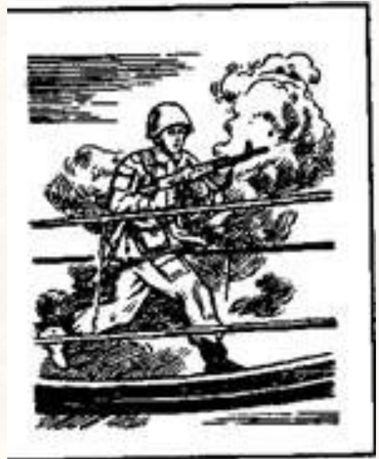
Мал. 141. Бір