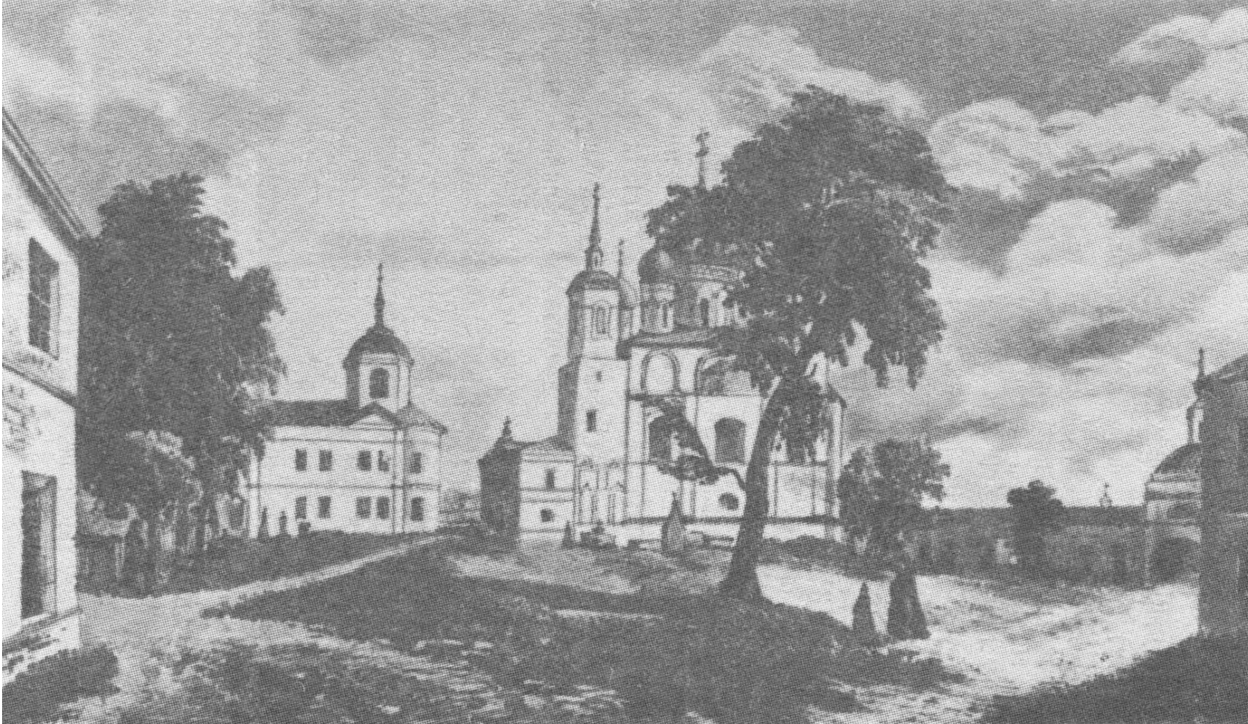
Новгородский Сырковъ Девичій монастырь