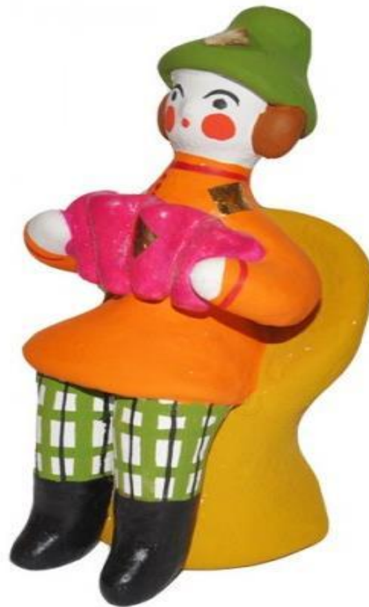
Ряженый с гармошкой