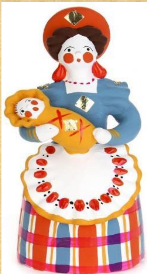
В кокошнике няня, На руках Ваня