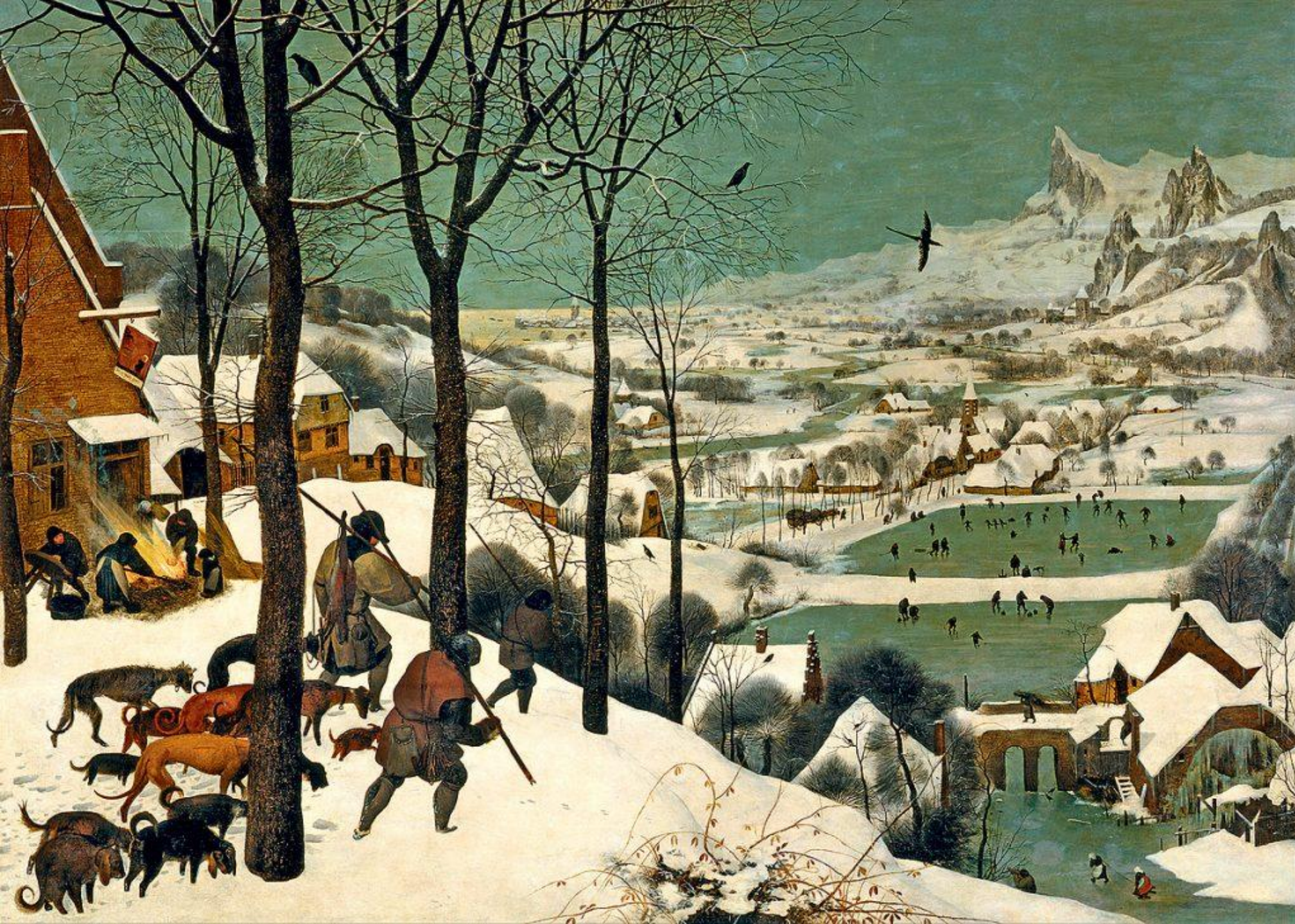
Охотники на снегу