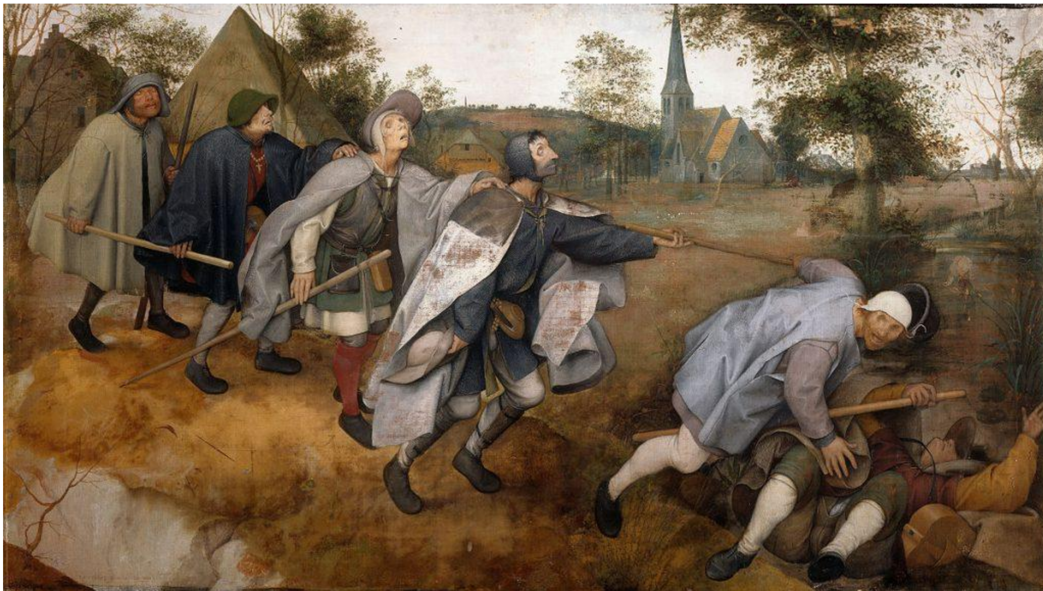
Притча о слепых