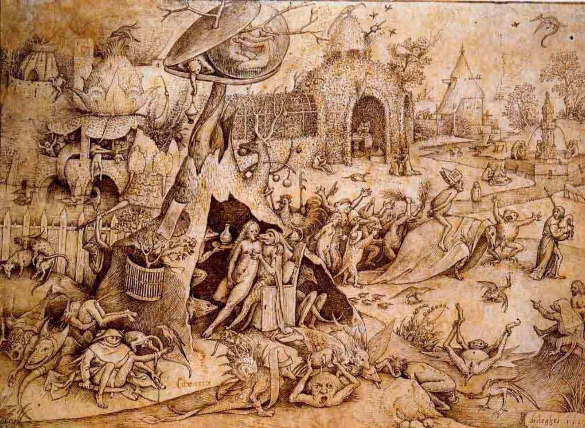
«Семь смертных грехов»