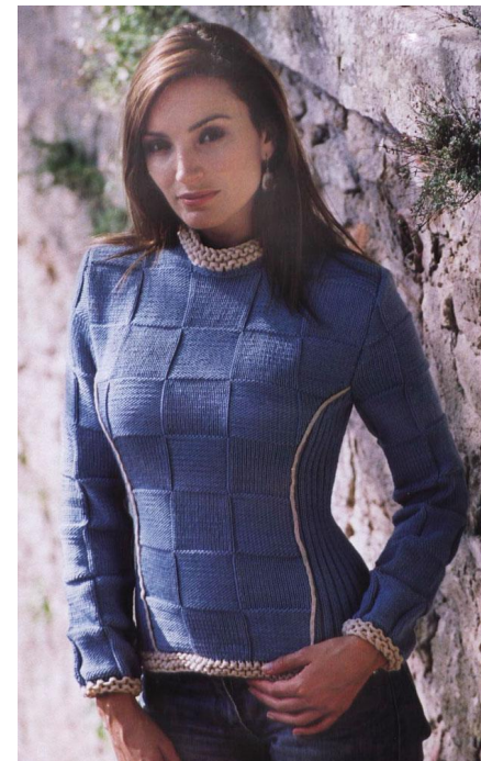
Пуловер из квадратов.