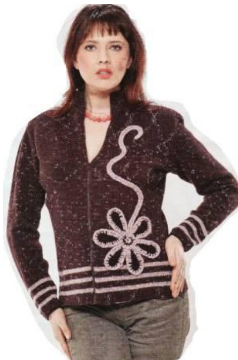
Свитер на молнии.