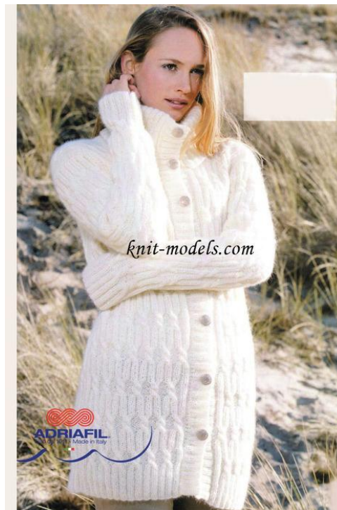
Кардиган на пуговицах.