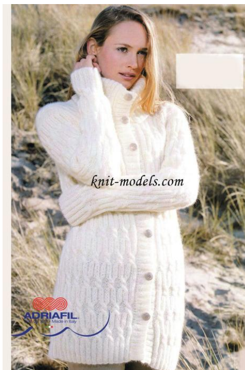
Кардиган на пуговицах.