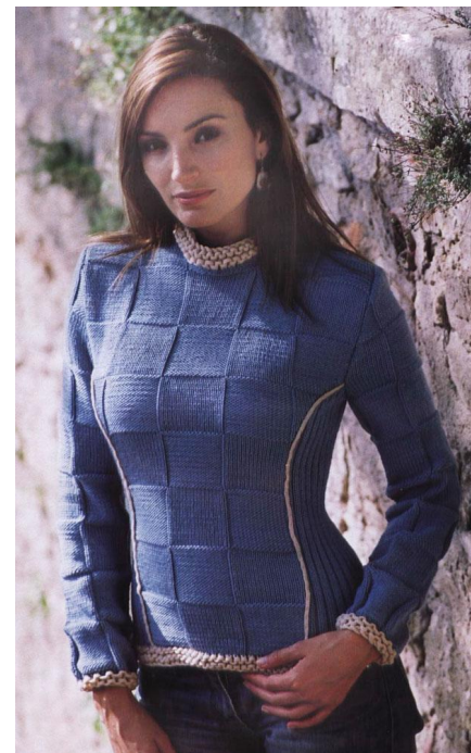
Пуловер из квадратов.