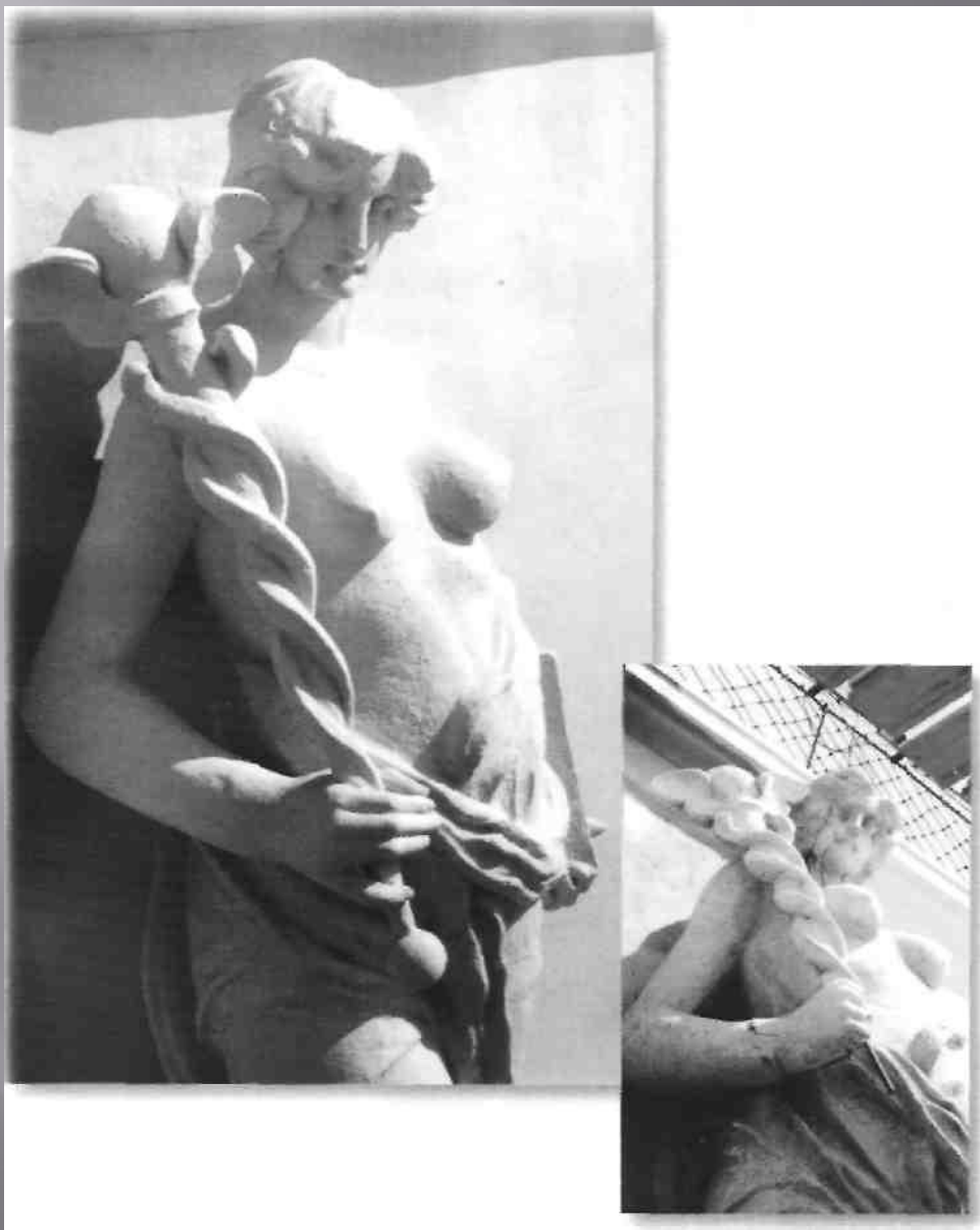
В. Ф. Винклер. «Управление» (фрагменты) —до и после реставрации